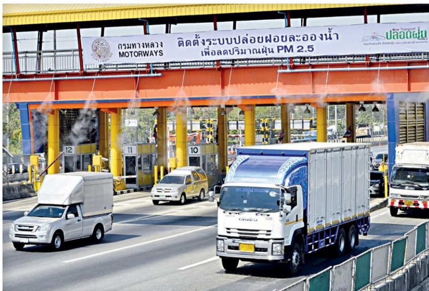
▲จุดติดตั้งเครื่อง...สะพานลอยคนเดินข้าม บริเวณด่านฯ ทับช้าง 1 (มุ่งหน้าบางพลี) บนทางหลวงพิเศษ (มอเตอร์เวย์) หมายเลข 9 เป็น 1 ใน 15 แห่งที่ติดตั้งเครื่องปล่อยฝอยละอองน้ำ เพื่อดักฝุ่น แก้ปัญหาฝุ่นละออง PM2.5 เกินค่ามาตรฐาน

ไทย อธิบดีกรมควบคุมมลพิษ (คพ.) กระทรวงทรัพยากรธรรมชาติและสิ่งแวดล้อม (ทส.) กล่าวว่า สถานการณ์ฝุ่นละอองที่เฝ้า 2.5 ในกรุงเทพฯ และปริมณฑลมีแนวโน้มสูงขึ้นเมื่อเทียบกับเมื่อวันที่ 18 ม.ค.ที่ผ่านมา สาเหตุจากสภาพอากาศมีลมสงบ ทำให้การสะสมของฝุ่นละอองเพิ่มสูงขึ้น โดยคุณภาพอากาศมีเกินค่ามาตรฐานเป็นพื้นที่สีส้ม มีผลกระทบต่อสุขภาพรวม 46 จุด วัดค่าได้ 45-93 ไมโครกรัม/ลูกบาศก์เมตร (มก./ลบ.ม.) โดยเฉพาะริมถนนสามเสน เขตพระนคร เป็นพื้นที่สีแดงวัดค่าได้ 93 มก./ลบ.ม. จึงประสานหน่วยงานที่เกี่ยวข้อง ทั้งกรมการขนส่งทางบก, กรมทางหลวง, บก.จร., กทม. และขสมก.,