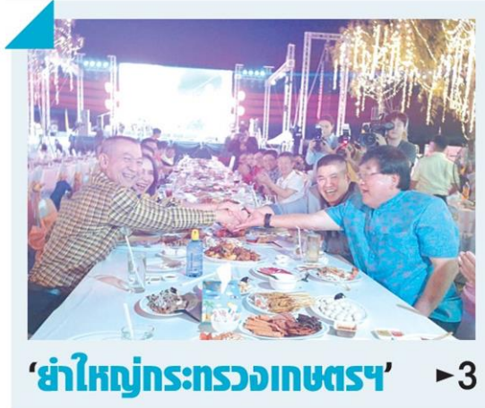
'ย่าใหญ่กระทรวงเกษตรฯ' ▶3