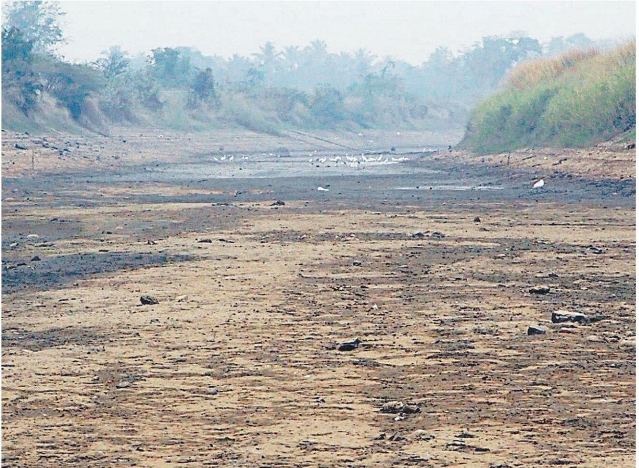
น้ำหายเกลี้ยง สภาพคลองมะขามเฒ่า จ.ชัยนาท ที่เชื่อมแม่น้ำเจ้าพระยาส่งน้ำไปยัง อ.อุทุมพร จ.สุพรรณบุรี มีสภาพแห้งขอด เหลือเพียงดินโคลนติดกันคลอง ทำให้สัตว์น้ำในคลองตายเกลื่อน รวมถึงหอยกาบ3 เหลี่ยม สัตว์ประจำถิ่นที่มีอยู่มาก แห่งตายคาคคลอง กลายเป็นแหล่งหาอาหารชั้นดีของนก.

น้ำและมาตรการบรรเทาภัยแล้งอย่างเคร่งครัด บัญชาการทหารพัฒนากองทัพบก กรมทรัพยากรน้ำ สนับสนุนให้เกษตรกรปลูกพืชใช้น้ำน้อย และงด งดบาคาล และองค์กรปกครองส่วนท้องถิ่น (อปท.) ปลูกพืชตามคำแนะนำของเจ้าหน้าที่ พร้อมเร่งรัด เพื่อบรรเทาปัญหาการขาดแคลนน้ำอุปโภค บริโภค การขุดบ่อและขุดลอกพัฒนาแหล่งน้ำที่สำคัญ ได้ และการเกษตร โดยโครงการดังกล่าวจะเสร็จสิ้น เน้นย้ำเรื่องการกักเก็บน้ำตาม โครงการแก้มลิงเพื่อ ภายใน 120 วัน เนื่องจากเป็นแผนการเร่งด่วน ทั้งนี้ ให้บรรลุผลตามเป้าหมายในปี 2563 ด้วย โดย โครงการที่จะนำเสนอเป็นโครงการขุดเจาะบ่อบาคาล นายกษัตริย์ศึกเสนาบดีกรมวังหน้า การวางท่อส่งน้ำ การก่อสร้างโรงสูบน้ำ และการติดตั้ง ทรงให้ความสำคัญในเรื่องนี้อย่างยิ่ง และนายกษัตริย์ศึกเสนาบดีกรมวังหน้า การวางท่อส่งน้ำ การก่อสร้างโรงสูบน้ำ และการติดตั้ง ถือว่าเรื่องนี้เป็นหัวใจสำคัญที่ต้องดำเนินการอย่าง จากการขาดแคลนน้ำอย่างไรก็ตาม โครงการดังกล่าว เร่งด่วน