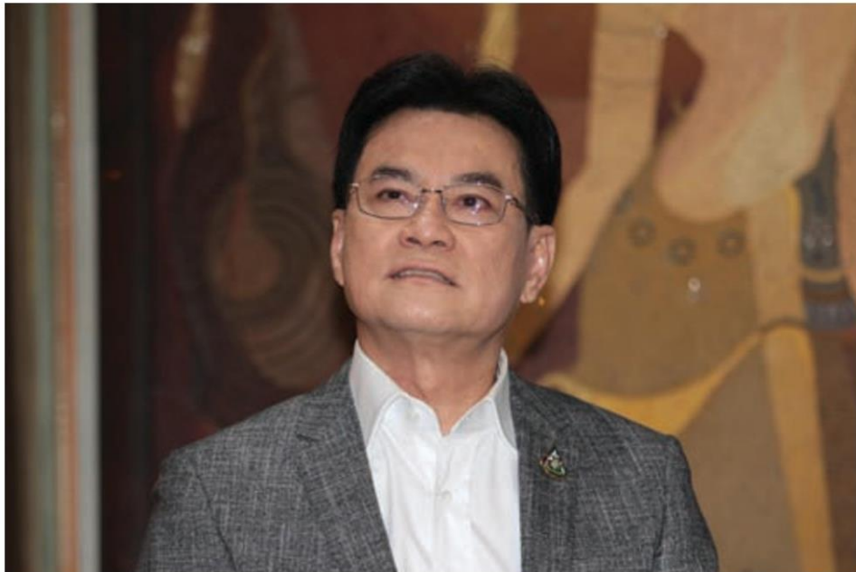
จรินทร์ ลักษณวิศิษฏ์ รองนายกรัฐมนตรี รัฐมนตรีว่าการกระทรวงพาณิชย์ และหัวหน้าพรรคประชาธิปัตย์

ชวน หลีกภัย ประธานสภาผู้แทนราษฎร ที่เป็นประธานรัฐสภา โดยตำแหน่งด้วย ก็หล่นคอมเมนต์การเมืองเกี่ยวกับการศึกษา แนวทางแก้ไขรัฐธรรมนูญที่สภาผู้แทนราษฎร เพิ่งผ่านญัตติตั้ง คณะกรรมาธิการ ไปหมาดๆ