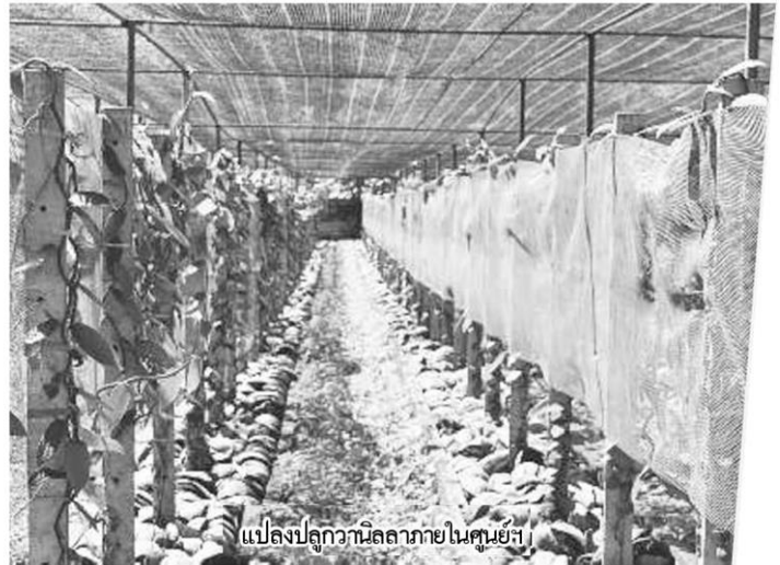
แปลงปลูกวานิลลาภายในศูนย์ฯ

“เรานำเข้าวานิลลาจากต่างประเทศปีหนึ่งเป็นมูลค่าหลายร้อยล้าน แต่วานิลลาที่เราทำการทดสอบอยู่นี้จะให้ผลผลิตทดแทนที่พอเหมาะสม เกษตรกรมีรายได้เลี้ยงตัวและจะสามารถทดแทนการนำเข้าได้ในอนาคต” ผอ.ศูนย์วิจัยดอยมูเซอเผยระหว่างนำชมแปลงปลูกพืชวานิลลา พร้อมย้ำว่าหน้าที่หลักของศูนย์ไม่ได้มีแค่กิจกรรมภายในศูนย์อย่างเดียว แต่จะมีเจ้าหน้าที่ลงพื้นที่ติดตาม