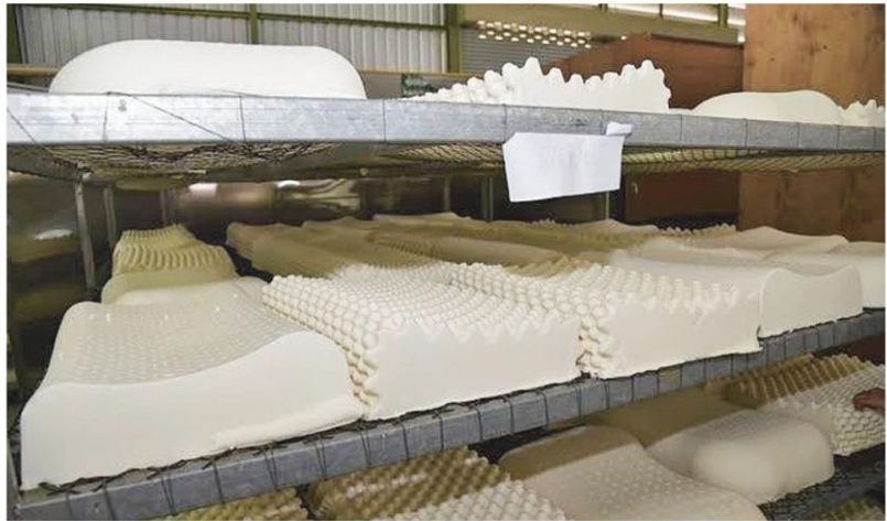
หมอนยางพารารัฐเคเว้ง - ขณะนี้เหลือเวลาอีก 1 เดือน จะเริ่มดำเนินการผลิตหมอนยางพารา 30 ล้านใบ ตั้งแต่วันที่ 1 ก.พ.63 แต่ยังไม่ได้ออกสรุปที่ชัดเจน

“ท่านนายกฯทำชัดทุกหน่วยงานรัฐให้มาช่วยดูแลผลผลิตของคนไทย ไม่ใช่แค่เรื่องเท่านั้น ซึ่งกระทรวงเกษตรฯทำเอ็มโอยูกับหน่วยงานต่าง ๆ ให้เพิ่ม