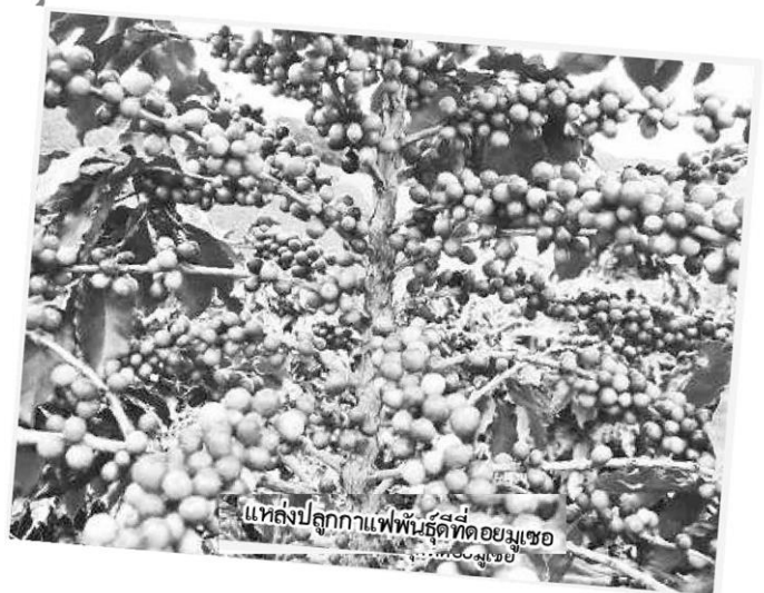
แหล่งปลูกกาแฟพันธุ์ดีที่ดอยมูเซอ

ผลงานของเกษตรกรที่ได้รับต้นพันธุ์ไปปลูกและแก้ปัญหาเรื่องโรคและแมลงให้แก่เกษตรกรด้วย