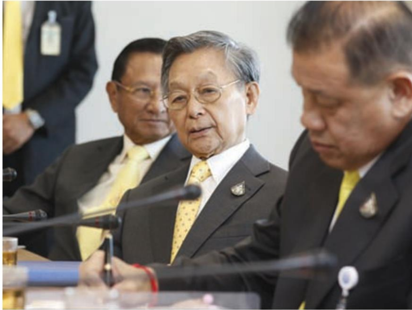
ชวน หลีกภัย ประธานรัฐสภา