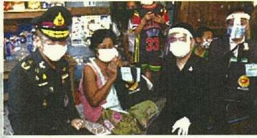
"ซีพีเอฟ" สันนิไทยไม่ขาดแคลนอาหาร เดินทนำมอบอาหารจากใจ เพื่อคนไทยทุกคน