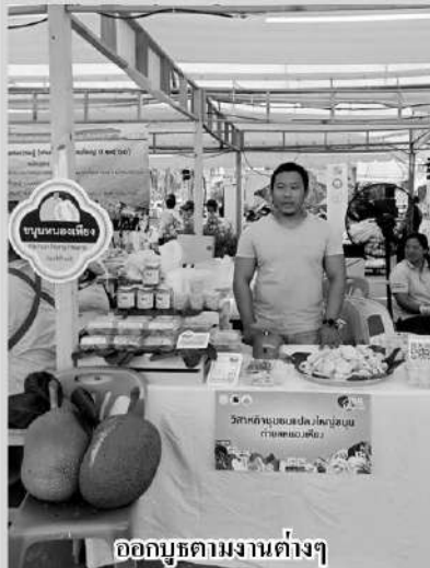
ออกบูธตามงานต่างๆ

ช่วงไม่กี่ปีมานี้กระทรวงเกษตรฯ มีนโยบายให้เกษตรกรรวมกลุ่มกันทำแปลงใหญ่ เพื่อลดต้นทุนและมีอำนาจต่อรองทางการตลาด ซึ่งประสบความสำเร็จเป็นที่