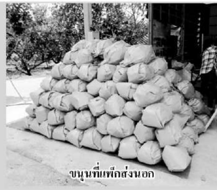
ขนุนที่เพิ่งส่งออก

ช่วงไม่กี่ปีมานี้กระทรวงเกษตรฯ มีนโยบายให้เกษตรกรรวมกลุ่มกันทำแปลงใหญ่ เพื่อลดต้นทุนและมีอำนาจต่อรองทางการตลาด ซึ่งประสบความสำเร็จเป็นที่