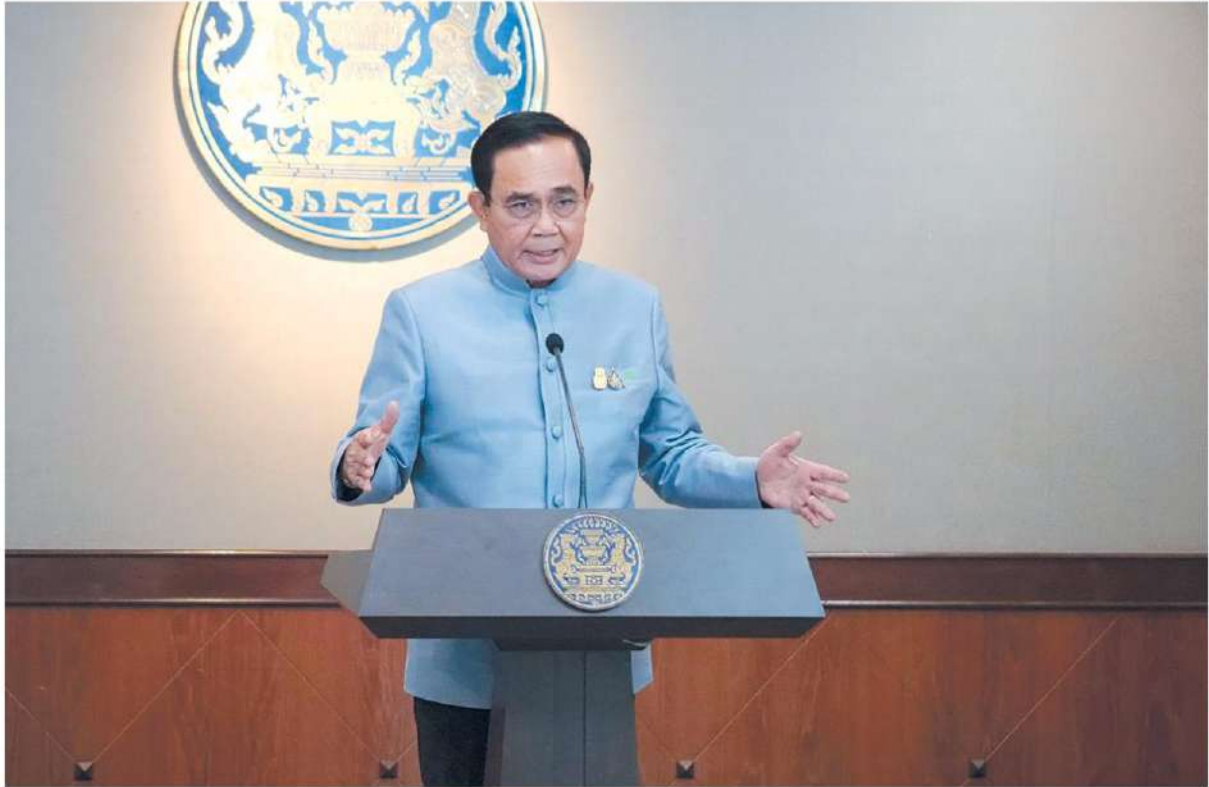
● ไม่พอจ่าย... พล.อ. ประยุทธ์ จันทร์โอชา นายกรัฐมนตรี และรัฐมนตรีว่าการกระทรวงกลาโหม แสดงภายหลังการประชุมคณะรัฐมนตรี(ครม.) ถึงความคืบหน้าการจ่ายเงินเยียวยาผู้ได้รับผลกระทบจากโควิด-19 เดือนละ 5,000 บาท เป็นเวลา 3 เดือน โดยยอมรับว่ารัฐบาลมีเงินพอที่จะจ่ายให้เดือนนี้เดือนเดียวเท่านั้น ที่ทำเนียบรัฐบาล

นี้อยู่ ต้องทำให้เป็นเม็ดเงิน เพื่อที่จะเอา มาเยียวยาตอนนี้มีแต่ตัวเลข หลายคนเอาตัวเลขนี้มาหารแบ่งกันไปเรียบร้อยแล้ว ซึ่งคาดว่าจะใช้ได้และได้เงินประมาณเดือน พ.ค. หรือ มิ.ย.นี้