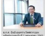
ร.ศ.ศ. ปวีณ... รัฐมนตรีช่วยว่าการกระทรวงพาณิชย์...