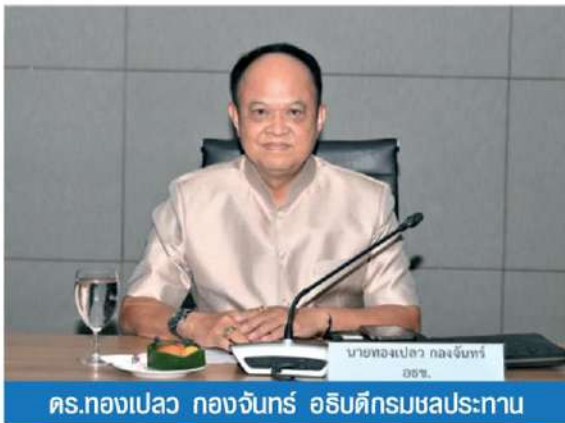
ดร.ทองเปลว กองจันทร์ อธิบดีกรมชลประทาน

เนื่องด้วยปัจจุบันการเปลี่ยนแปลงสภาพภูมิอากาศทำให้เกิดฤดูกาลที่ผันผวน โดยในปีที่ผ่านมาเกิดภาวะฝนทิ้งช่วงยาวนาน แล้วกลับมีฝนตกหนักจนน้ำท่วม อีกทั้งทำให้หลายพื้นที่เกิดภาวะแล้งต่อเนื่อง และต้องประสบกับปัญหาขาดแคลนน้ำกิน น้ำใช้ แต่ถ้ามีพื้นที่กักเก็บน้ำเพิ่มขึ้น เชื่อว่าจะช่วยบรรเทาผลกระทบจากภัยแล้งและอุทกภัยได้มาก