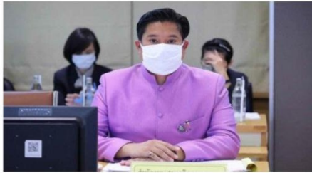
เลขฯ สศก. ย้ำชัดต้นทุนไข่ไก่ 2.69 บาท/ฟอง เหมาะสมแล้ว ณ. จินตฤกษ์กล่าวสุนทรพจน์สร้างมูลค่าเพิ่ม