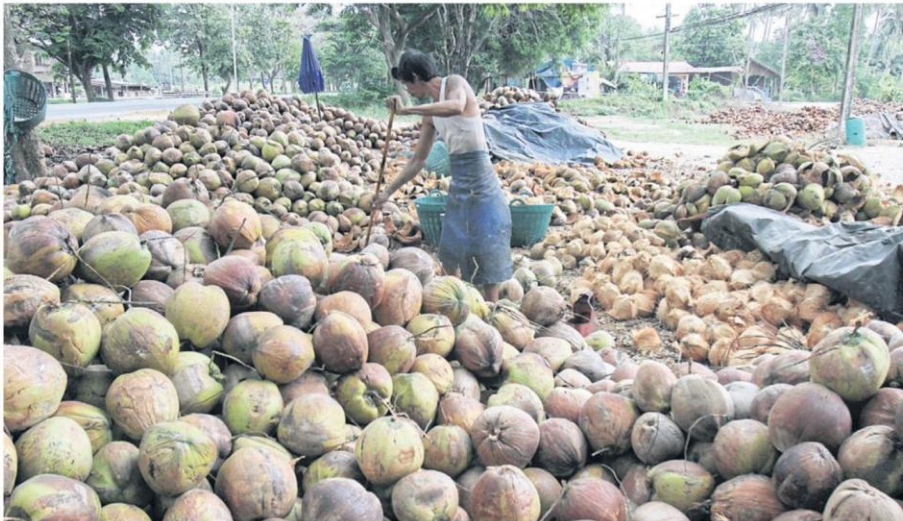
Coconuts at a plantation in a village of Thap Sakae district, Prachuap Khiri Khan province. TAWATCHAI KEMGUMNERD