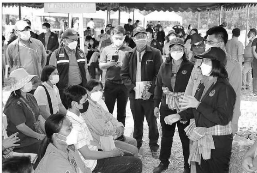
หยุดเผา : นางอัญชลี สุวจิตตานนท์ รองอธิบดีกรมส่งเสริมการเกษตร พร้อมคณะลงพื้นที่ จ.สุพรรณบุรี เพื่อเดินทางโครงการส่งเสริมการหยุดเผา ปรับเปลี่ยนวิธีการทำการเกษตร เพื่อลดปัญหาฝุ่นและก๊าซเรือนกระจก

อ.ดอนเจดีย์ เกษตรกรเข้าร่วม 200 ราย มีกิจกรรมสร้างการรับรู้และกิจกรรมเสนอทางเลือกลดการเผา ดังนี้ 1.ถ่ายทอดความรู้และพัฒนาศักยภาพเกษตรกรให้สามารถเป็นวิทยากรได้ ซึ่งเกษตรกรมีความสนใจเรื่องการเพาะเห็ดฟาง, น้ำหมักสลายต่อซัง, การทำจุลินทรีย์หน่อกล้วย และการแปรรูปฟางข้าวโดยอัดเป็นแท่ง 2.นำร่องสาธิตเทคโนโลยีการจัดการเศษวัสดุการเกษตรทดแทนการเผา โดยการไถกลบต่อซังอ้อย, การใช้รถตัดต่อซังข้าว และการทำปุ๋ยหมักจากใบอ้อยและฟางข้าว 3.รณรงค์ลดการเผาในท้องถิ่น เพื่อกระตุ้นเกษตรกรให้ตระหนักถึงผลกระทบจากการเผาในพื้นที่การเกษตรและนำเสนอทางเลือกการใช้ประโยชน์จากเศษวัสดุทางการเกษตรและเทคโนโลยีทางการเกษตรทดแทนการเผา และ 4.ส่งเสริมให้เกษตรกรปลูกอ้อยเพื่อรองรับรถตัดเพื่อลดการเผาอ้อย และจากการดำเนินโครงการส่งเสริมการหยุดเผาในพื้นที่การเกษตรอย่างต่อเนื่อง