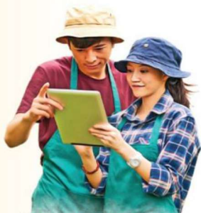
ฐาน INFO GRAPHIC