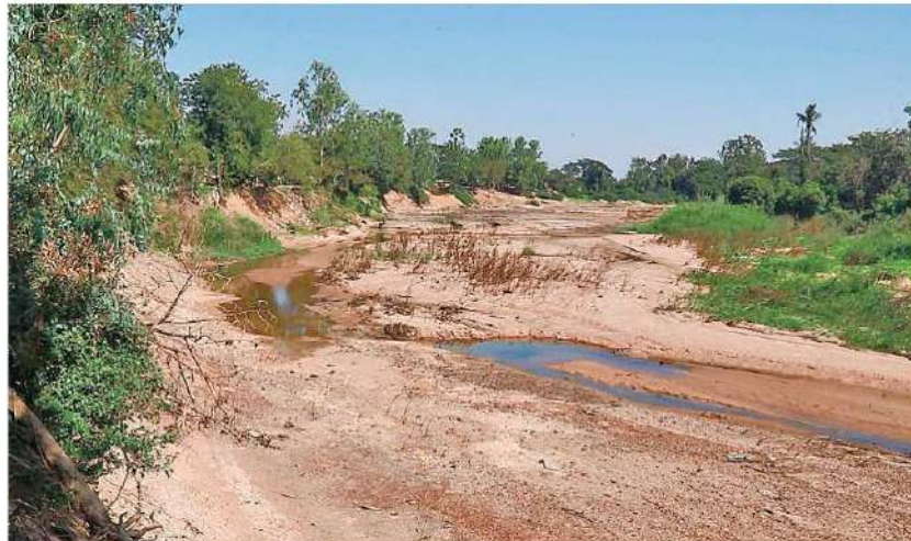
น้ำยมแห้ง - สภาพของแม่น้ำยมที่ไหลผ่านบริเวณ ต.วังจิก อ.โพธิ์ประทับช้าง จ.พิจิตร แห่งขอเป็น คืนทราย เกษตรกรต้องหันมาใช้น้ำบาดาลได้ดินสูงขึ้นมหาล่อเลี้ยงต้นข้าวแทน เมื่อวันที่ 15 มกราคม