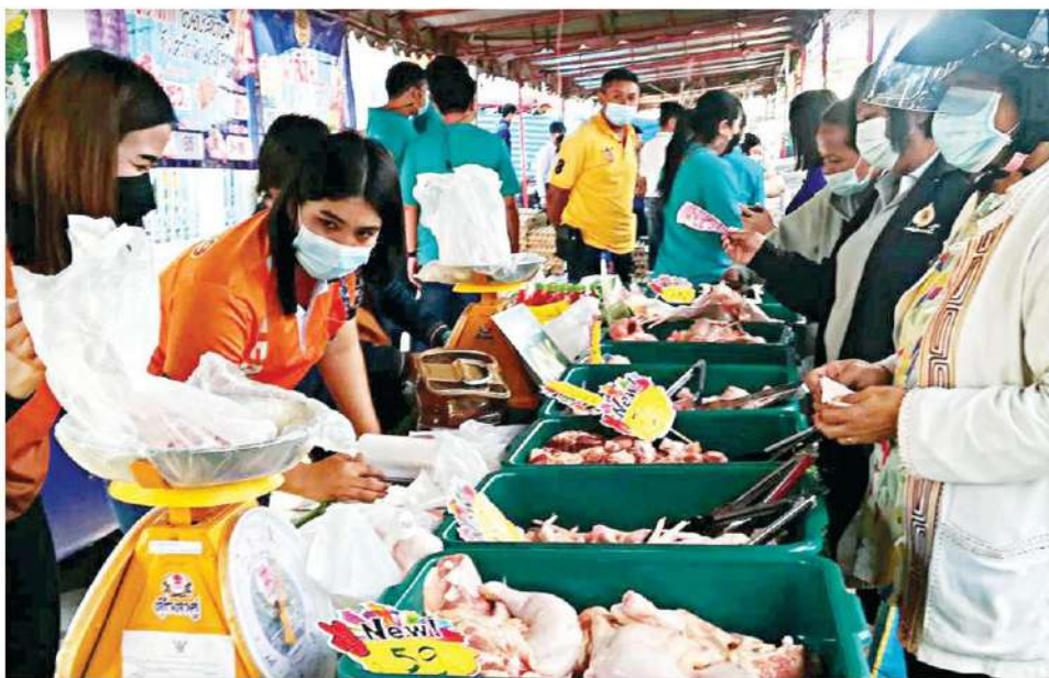
▲ แห่ซื้อแน่น...ประชานยื่นเข้าคิวซื้อเนื้อหมูราคาถูกที่ตลาดประชารัฐ หรือตลาดนัดเกษตรกรหน้าศาลา กลางจังหวัดพิษณุโลกกันแน่นขนัด หลังทางจังหวัดร่วมกับ พณ.นำมาจำหน่ายช่วยเหลือลดภาระค่าครองชีพ