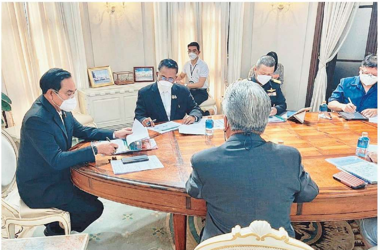
▲ แก้วโรคหมู พล.อ.ประยุทธ์ จันทร์โอชา นายกรัฐมนตรี เรียกนายสัตวแพทย์สรวิศธานีโต อธิบดีกรมปศุสัตว์ เข้าหารือที่ตึกไทยคู่ฟ้า ทำเนียบรัฐบาล ถึงแนวทาง แก้ปัญหาโรคระบาดอหิวาต์แอฟริกาในสุกร หรือ ASF หลังทำเนื้อหมูแพ่งเป็นประวัติการณ์ สินค้าอุปโภคบริโภคทยอยปรับราคาตาม สร้างความเดือดร้อนให้กับประชาชน.

“บักตู่” เรียกอธิบดีกรมปศุสัตว์แจงปมร้อนโรคอหิวาต์ ระบาดในสุกร ต้นเหตุทำหมูแพ่งเป็นประวัติการณ์ แนะนำ 4 แนวทางเร่งแก้ปัญหา คาดใช้เวลากอบกู้วิกฤติ 8-12 เดือน แนะตั้งวอร์รูมแจงสถานการณ์รายวัน ★ นีต่อหน้า 8