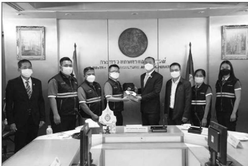
ยกระดับ : นายเฉลิมชัย ศรีอ่อน รมว.เกษตรและสหกรณ์ มอบเสื้อให้เจ้าหน้าที่กรมส่งเสริมการเกษตร ขับเคลื่อนนโยบาย “เกษตรกรปราดเปรื่อง” เพื่อยกระดับเกษตรกรให้เป็นผู้ประกอบการเกษตรต้นแบบ

หรือประยุกต์ใช้ ตั้งแต่ร้อยละ 8-71 และเพื่อเป็นการวางกรอบแนวทางการขับเคลื่อนในปี 2565 จึงจัดการประชุมเชิงปฏิบัติการเพื่อขับเคลื่อนพัฒนาเกษตรกรปราดเปรื่องขึ้นมา เพื่อให้ผู้ผ่านการอบรม 21 คน ได้แลกเปลี่ยนแนวคิดและวางกรอบแนวทางการขับเคลื่อน รวมกลุ่มเป็นเครือข่ายที่ยั่งยืนในการทำการเกษตรแบบระบบธุรกิจเกษตร