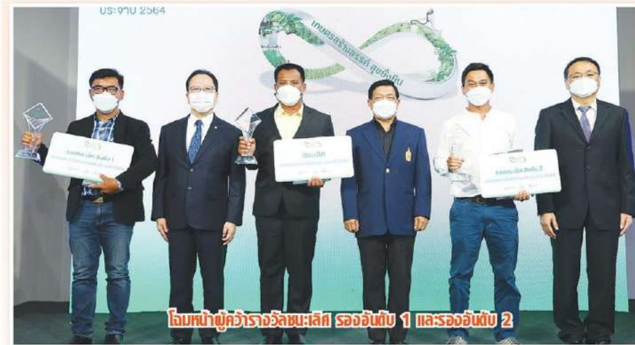
มอบถ้วยรางวัลชนะเลิศ รองอันดับ 1 และรองอันดับ 2