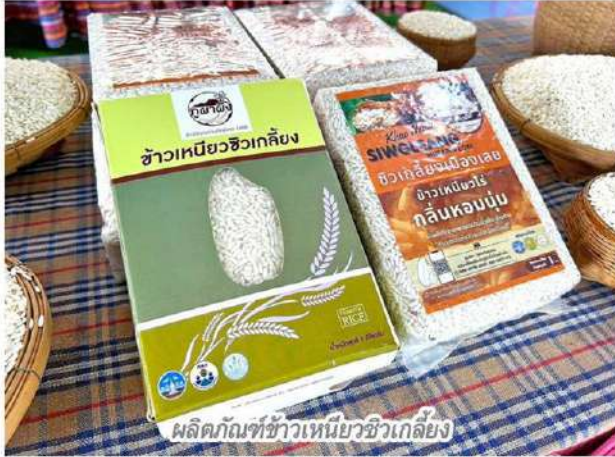
ผลิตภัณฑ์ข้าวเหนียวชีวเกลี้ยง