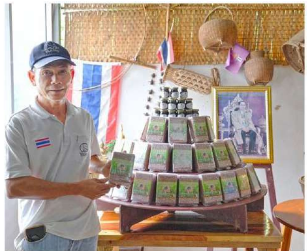
แสวง ดาปะ

ในพื้นที่ภาคอีสาน มีพื้นที่ปลูกข้าวถึง 40 ล้านไร่ โดยเฉพาะจังหวัดเลย ซึ่งมีพื้นที่ปลูกข้าวประมาณ 4 แสนไร่ คิดเป็น 10 เปอร์เซ็นต์ของพื้นที่เพาะปลูกข้าวในภาคตะวันออกเฉียงเหนือ ข้าวทั้ง 2 สายพันธุ์นี้ จึงเป็นข้าวพื้นถิ่นที่มีอัตลักษณ์อย่างยิ่ง เป็นสิ่งบ่งชี้ภูมิศาสตร์หรือ GI ที่มีความโดดเด่น หอมอร่อย มีเอกลักษณ์เฉพาะ