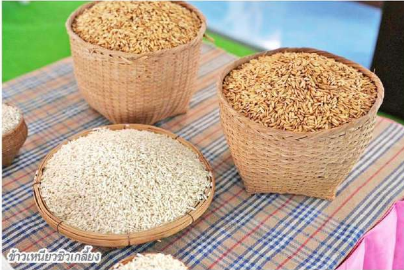
ข้าวเหนียวชีวเกลี้ยง