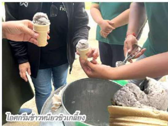
ไอศกรีมข้าวเหนียวชีวเกลี้ยง

"การมีแปลงเรียนรู้ และแปลงคัดเมล็ดพันธุ์อย่างยั่งยืนนั้น จะช่วยให้ข้าวเหนียวแดงเมืองเลย อยู่คู่จังหวัดเลยไปชั่วลูกชั่วหลาน เป็นลักษณะเด่น เป็นการสร้างรายได้เสริม และเพิ่มมูลค่าสิ่งเหล่านี้ ก็ควบคู่กันไป" แสวงทิ้งท้าย