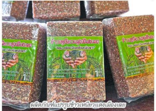
ผลิตภัณฑ์แปรรูปข้าวเหนียวแดงเมืองเลย

แสวงเล่าต่อว่า หลังจากนั้นก็ได้มีการนำพันธุ์ข้าวเหนียวแดงเมืองเลย มาปลูกอยู่ในศูนย์เรียนรู้ และในปี 2557 ก็ได้ส่งกลับไปประกวดที่จังหวัดยโสธร ประชันกับข้าวเหนียวพื้นบ้านกว่า 90 สายพันธุ์