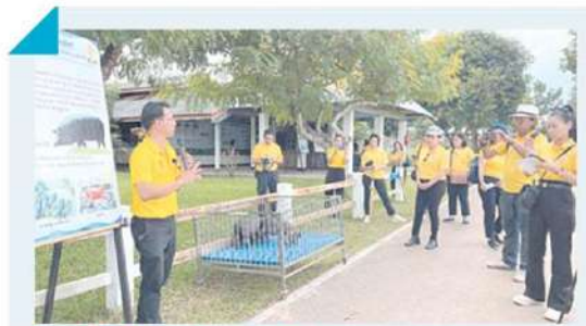
ศูนย์ศึกษาการพัฒนาภูพานฯ ขยายผลสำเร็จสู่ราษฎรทั้งไทย และสปป.ลาว