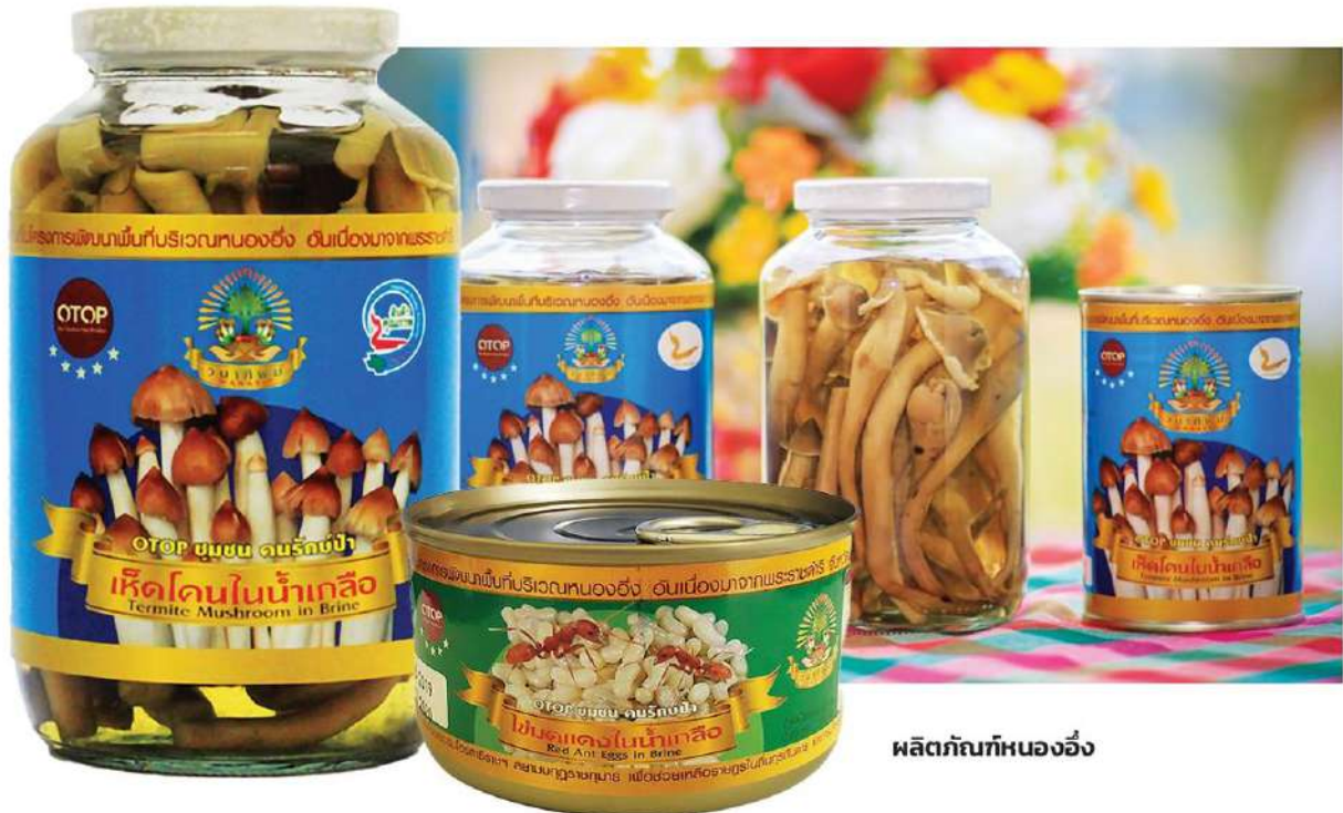
ผลิตภัณฑ์หนองอึ่ง

หัวข้อข่าว: สหกรณ์การเกษตรฯ หนองอึ่ง ต้นแบบพัฒนาพื้นที่ หนึ่งในโครงการพระราชดำริ