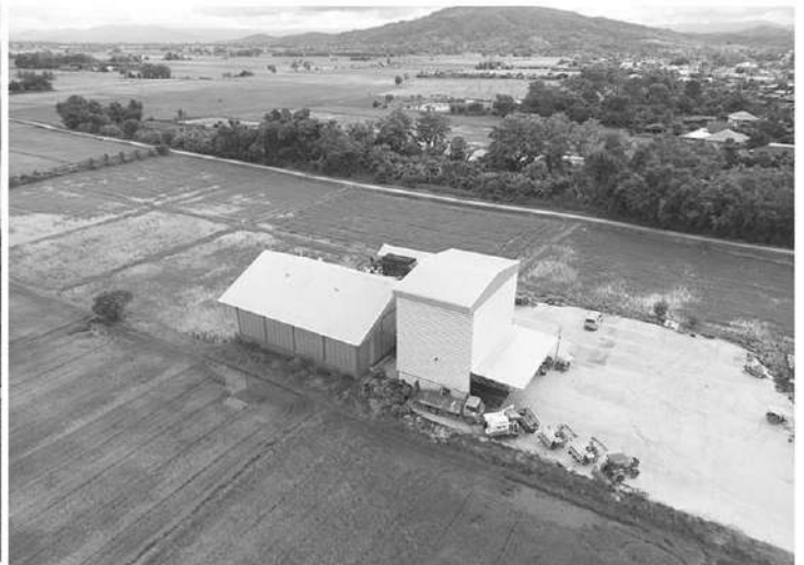
พื้นที่นาศูนย์ข้าวชุมชนศรีดอนมูล