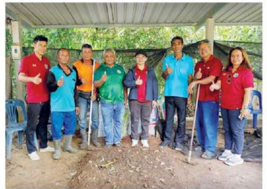
ถ้าหากมีปัญหาติดขัดอย่างไรให้แจ้งสำนักงานการปฏิรูปที่ดินเพื่อเกษตรกรรม