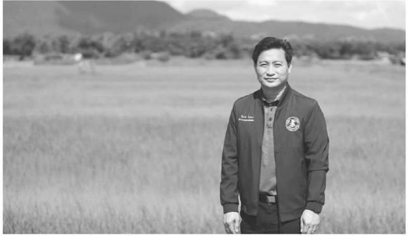
โอวาท ยิ่งลาภ