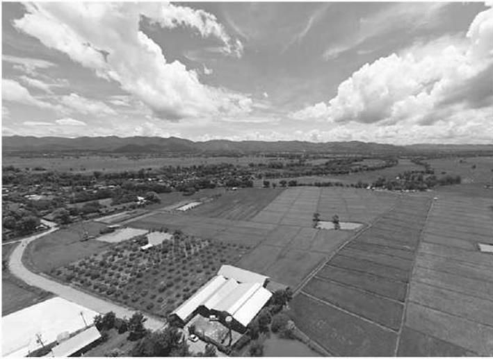
พื้นที่นาวิสาหกิจชุมชนศูนย์ส่งเสริมและผลิตพันธุ์ข้าวชุมชนตำบลจุน