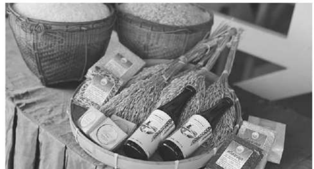
ผลิตภัณฑ์คราฟต์เบียร์

รับรองคุณภาพ GI เป็นตัวอย่างของชุมชนที่สร้างมูลค่าจากการใช้กรรมวิธีเกษตรอินทรีย์ ซึ่งสอดคล้องกับในช่วงสองปีที่ผ่านมามูลค่าสินค้าเกษตรอินทรีย์เพิ่มขึ้น 27% (มูลค่าปี 2565 อยู่ที่ 9,169.29 ล้านบาท เพิ่มขึ้นจากปี 2564 ที่ 7,127.63 ล้านบาท) มีการเพิ่มขึ้นของพื้นที่การทำเกษตรอินทรีย์กว่า 4% รวมถึงผู้บริโภคทั่วโลกที่หันมาให้ความสำคัญกับการบริโภคสินค้าเพื่อสุขภาพเพิ่มมากขึ้น"