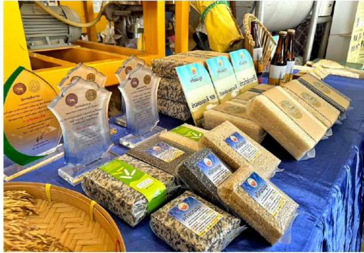
ข้าวหอมมะลิ (กข15 และกข105) ข้าวเหนียว (กข6 สันป่าตอง และกข-แม่ใจ 2) ศูนย์ข้าว ศรีดอนมูล

หัวข้อข่าว: แปรรูปปัง สร้างแบรนด์เปรี้ยว! วิสาหกิจชุมชนจุน ศูนย์ข้าว ศรีดอนมูล