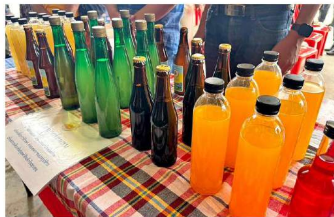
คราฟต์เบียร์ ไชว สาโท ผลิตภัณฑ์แปรรูป ศรีดอนมูล

เมืองพะเยา แล่งนาผลิตข้าวคุณภาพ 5 สายพันธุ์ เพิ่มความนิยมการบริโภคข้าวตอยในแบรนด์ “ข้าวหอมสร้อยศรี”