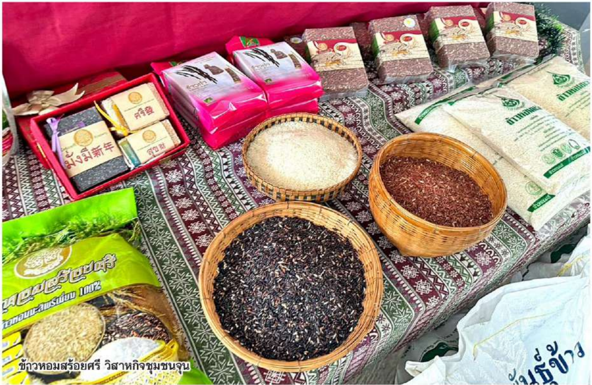
ข้าวหอมสร้อยศรี วิสาหกิจชุมชนจุน

หัวข้อข่าว: แปรรูปปัง สร้างแบรนด์เปรี้ยว! วิสาหกิจชุมชนจุน ศูนย์ข้าว ศรีดอนมูล