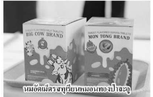
นมอัลเม็ครสทุเรียนหอมทองป่าละอู