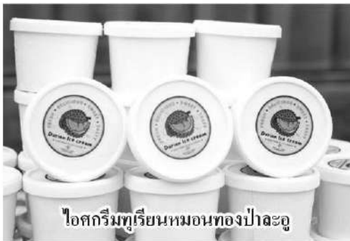
ไอศกรีมทุเรียนหมอนทองป่าละอู

สำหรับตลาดทุเรียนหมอนทองป่าละอูนั้น ปัจจุบันเน้นจำหน่ายในประเทศ ผ่านการขายหน้าฟาร์ม ขายออนไลน์ หรือ