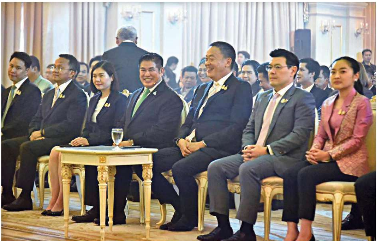
▲ ยกระดับ...นายเศรษฐา ทวีสิน นายกฯ พร้อมด้วย ร.อ.ธรรมนัส พรหมเผ่า รมว.เกษตรฯ แลงงวิสัยทัศน์และแนวทางเพื่อ ขับเคลื่อน IGNITE THAILAND จุดพลังรวมใจไทยต้องเป็นหนึ่งในยกระดับประเทศไทยศูนย์กลางเกษตรและอาหารของโลก