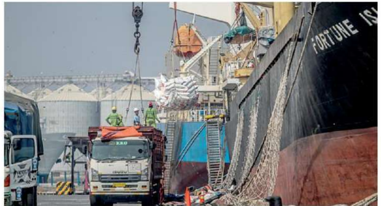
คนงานโกลด์กระสอบข้าว ซึ่งส่งมาจากไทย ที่ท่าเรือตันจุง ฮีปส์ ในเมือง เซมารัง จังหวัดชวากลาง ประเทศอินโดนีเซีย

กระทบจากปรากฏการณ์เอลนีโญ โดยคาดการณ์การส่งออกข้าว ทั่วโลก ประจำปี 2566/2567 จะเพิ่มขึ้นจากฤดูกาลก่อน หน้าประมาณ 583,000 ตัน หรือราว 0.1% เท่านั้น สำหรับอินเดียซึ่งยังคงเป็นประเทศผู้ส่งออกข้าวรายใหญ่