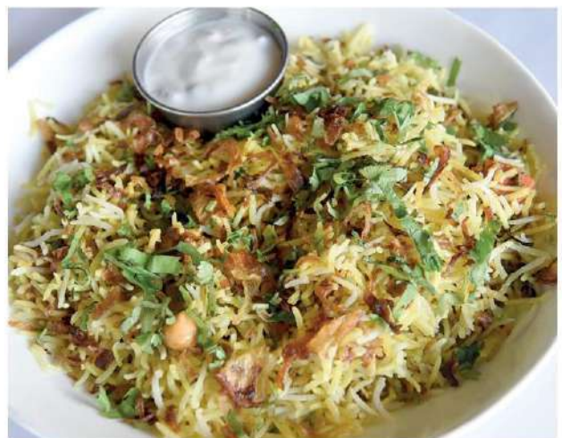
บริษัทยาพิชิต มีส่วนประกอบสำคัญ คือ ข้าวบาสมาดิ

อินเดีย ประเทศผู้ส่งออกข้าวรายใหญ่ที่สุดของโลก ด้วยการครองส่วนแบ่งตลาดมากกว่า 40% หรือ 55.4 ล้านตัน เมื่อปีที่แล้ว รัฐบาลส่งออกข้าวขาวที่ไม่ใช่ข้าวบาสมาดิ เพื่อรักษาเสถียรภาพของตลาดภายในประเทศ ตั้งแต่ช่วงปลายเดือนก.ค. 2566 แม้ไม่ใช่ครั้งแรกที่อินเดียประกาศระงับส่งออกข้าว