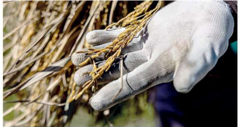
เกษตรกรแสดงรวงข้าวซึ่งเพิ่งถูกเก็บเกี่ยว ที่ทุ่งนาแห่งหนึ่ง ในจังหวัด อุบลราชธานีของไทย

ข้อมูลจากกระทรวงเกษตรสหรัฐฯระบุว่า ผลผลิตข้าวของ โลกในปีนี้จะยังไม่เพิ่มขึ้นมากนัก เนื่องจากประเทศผู้ผลิตข้าว รายใหญ่ของโลก ซึ่งส่วนใหญ่อยู่ในทวีปเอเชีย ยังคงได้รับผล