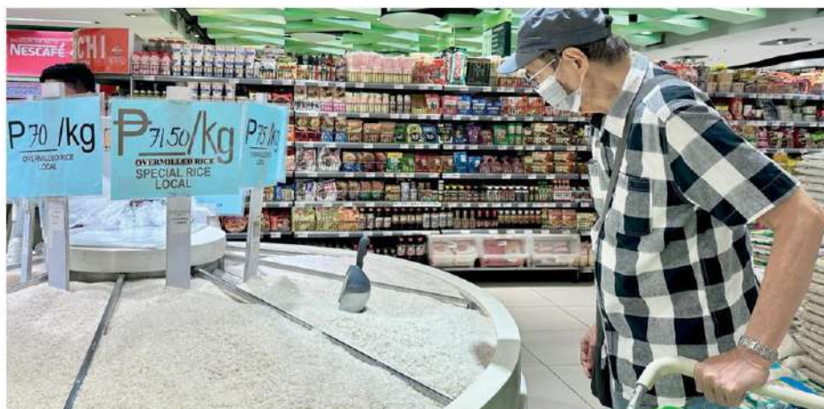
ประชาชนเลือกซื้อข้าวสาร ที่ซูเปอร์มาร์เกตแห่งหนึ่ง ในกรุงมะนิลา ประเทศฟิลิปปินส์

กระทบจากปรากฏการณ์เอลนีโญ โดยคาดการณ์การส่งออกข้าว ทั่วโลก ประจำปี 2566/2567 จะเพิ่มขึ้นจากฤดูกาลก่อน หน้าประมาณ 583,000 ตัน หรือราว 0.1% เท่านั้น สำหรับอินเดียซึ่งยังคงเป็นประเทศผู้ส่งออกข้าวรายใหญ่