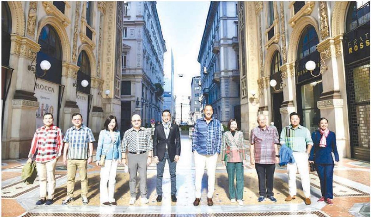
เศรษฐา ทวีสิน

หลังสภาพัฒน์ รายงานผลิตภัณฑ์มวลรวมในประเทศ หรือ จีดีพี ไตรมาส 1 ปี 2567 ขยายตัวแค่ 1.5% โดยเติบโตต่ำที่สุดในประเทศอาเซียน และแนวโน้มทั้งปีหันเหลือแค่ 2.5% จากสารพัดปัจจัยรุมเร้า ทำเอา เศรษฐา ทวีสิน นายกรัฐมนตรี ถึงกับรื้อนรุ่ม และโพสต์ข้อความบน X นัดหมายประชุม “คณะรัฐมนตรีเศรษฐกิจ” ทันทีในวันที่ 27 พฤษภาคม หลังเสร็จสิ้นภารกิจทัวร์ต่างประเทศ