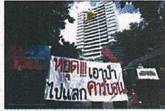
จุดยืนไทยต่อเวทีโลกเดือด COP29