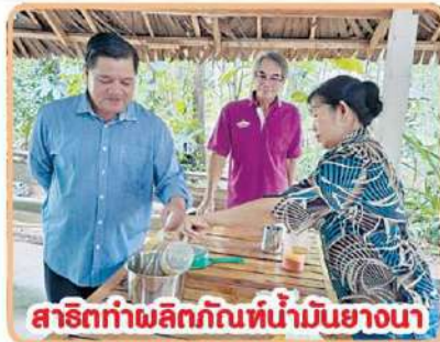
สาธิตทำผลิตภัณฑ์น้ำมันยางนา

ผู้นำ ชุมชนบ้านหลุมมะขาม บอกไว้ด้วยว่า วันนี้ชาวบ้านที่นี่ "มีรอยยิ้ม" จากที่แทบจะไร้รอยยิ้มมานาน และเมื่อถอดรหัสรอยยิ้มที่มีความสุข ก็พบว่า เป็นเพราะ "ป่าชุมชนที่ใกล้บ้าน" เพราะ ป่าต้นไม้ "เชื่อมโยงวิถีชีวิตของคน" ซึ่ง ป่าเป็นทั้งหมดของผู้คนที่นี่ ทั้งเป็น อาหาร เป็นยา เป็นของใช้ เป็นพลังงาน เป็นได้ทั้งหมด ไม่ใช่ปลูกแค่ให้ร่มรื่น แต่