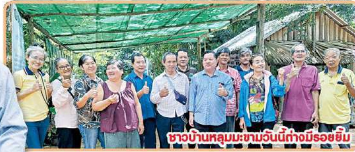
ชาวบ้านหลุมมะขามวันนี้กำลังมีรอยยิ้ม