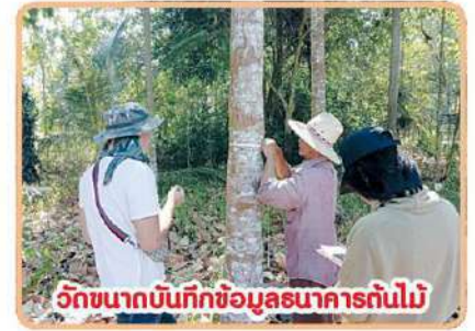
วิถีชนากันก็ก้มข้มมูลมะขามการกันไม้