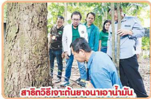
สาธิตวิธีการเก็บยางนาอย่างยั่งยืน

ก็แจก เหลือแจกก็แจก ขาย เปลี่ยนการเพาะปลูก จากเดิมปลูกแต่อย่างเดียว ก็ส่งเสริมปลูกพืชผักสวนครัวและสมุนไพรต่าง ๆ แซมสลบไว้ในพื้นที่ป่า กับเสริมการปลูกป่าควบคู่ไปพร้อมกันด้วย เพื่อเพิ่มต้นไม้หลักที่สำคัญ อย่างยางนา ตะเคียน ประดู่ มะค่า ตะแบก เป็นต้น