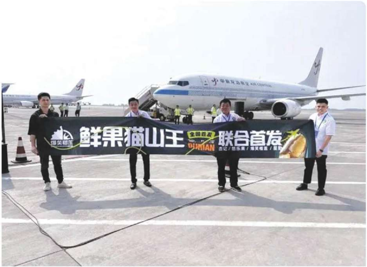
ทุเรียนมุขังคิงผลสดจากมาเลเซียล็อตแรกมาถึงที่สนามบินเมืองเจิ้งโจว มณฑลเหอหนัน ประเทศจีน เมื่อวันที่ 25 ส.ค. 2024

กล่าวสำหรับผลไม้ประเภททุเรียนนั้น ถือเป็นธุรกิจข้ามชาติที่มีมูลค่านับแสนล้านบาทต่อปีและการแข่งขันในตลาดโลกของทุเรียนก็มุ่งเน้นไปที่การแข่งขันในตลาดจีน โดยปัจจัยที่ทำให้การแข่งขันเข้มข้นขึ้นมีสามปัจจัยด้วยกันคือ