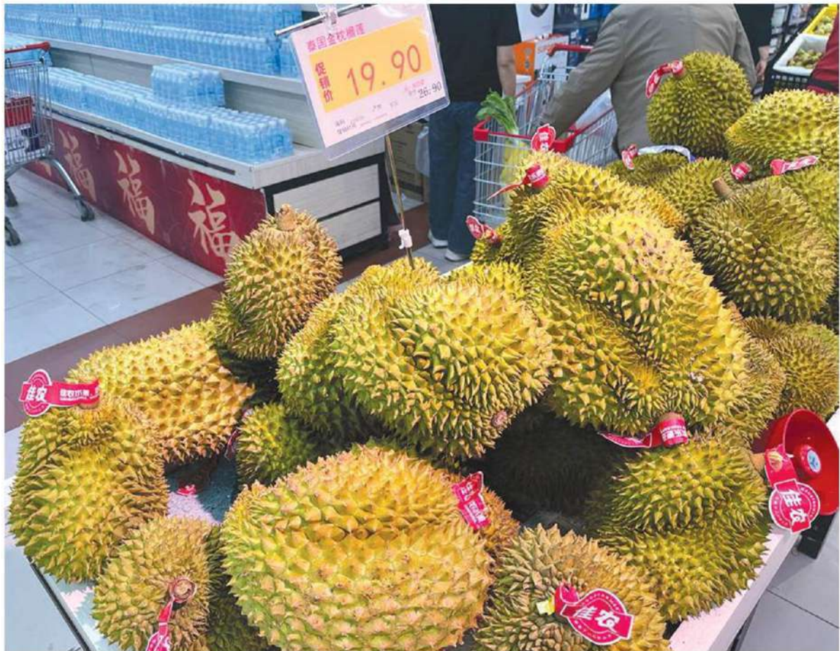
ทุเรียนหมอนทองของไทยในซูเปอร์มาร์เกตแห่งหนึ่งในปักกิ่ง ราคาครึ่งกิโลกรัม 19.90 หยวนหรือประมาณ 100 บาท