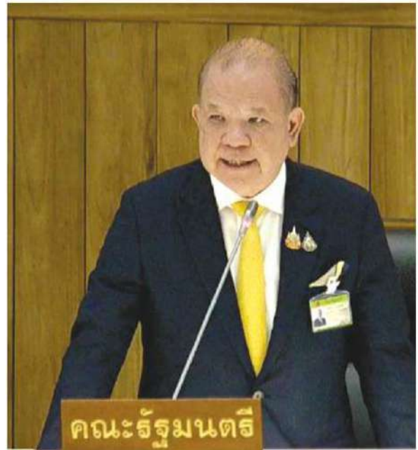
นายพิชัย นริพทะพันธุ์ รัฐมนตรีว่าการกระทรวงพาณิชย์

สำหรับมาตรการในการจัดการกับปัญหาสินค้าด้อยคุณภาพที่เป็นอันตรายต่อผู้บริโภคที่จะเข้ามาจากแพลตฟอร์มอีคอมเมิร์ซข้ามชาติ กระทรวงพาณิชย์ได้กำหนดให้สินค้าจากแพลตฟอร์มอีคอมเมิร์ซข้ามชาติ รวมทั้งแพลตฟอร์มอีคอมเมิร์ซ Temu จะต้องผ่านมาตรฐานผลิตภัณฑ์อุตสาหกรรม (มอก.) และได้รับการรับรองมาตรฐานอาหารและยา (อย.)