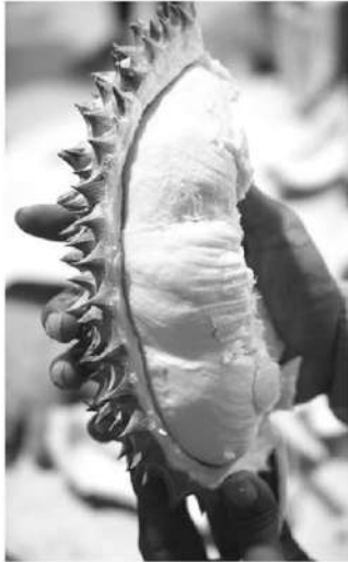
ทุเรียนหอมทองธารโต พูเหลืองใหญ่