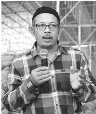
มะเสาสดี โสภาค