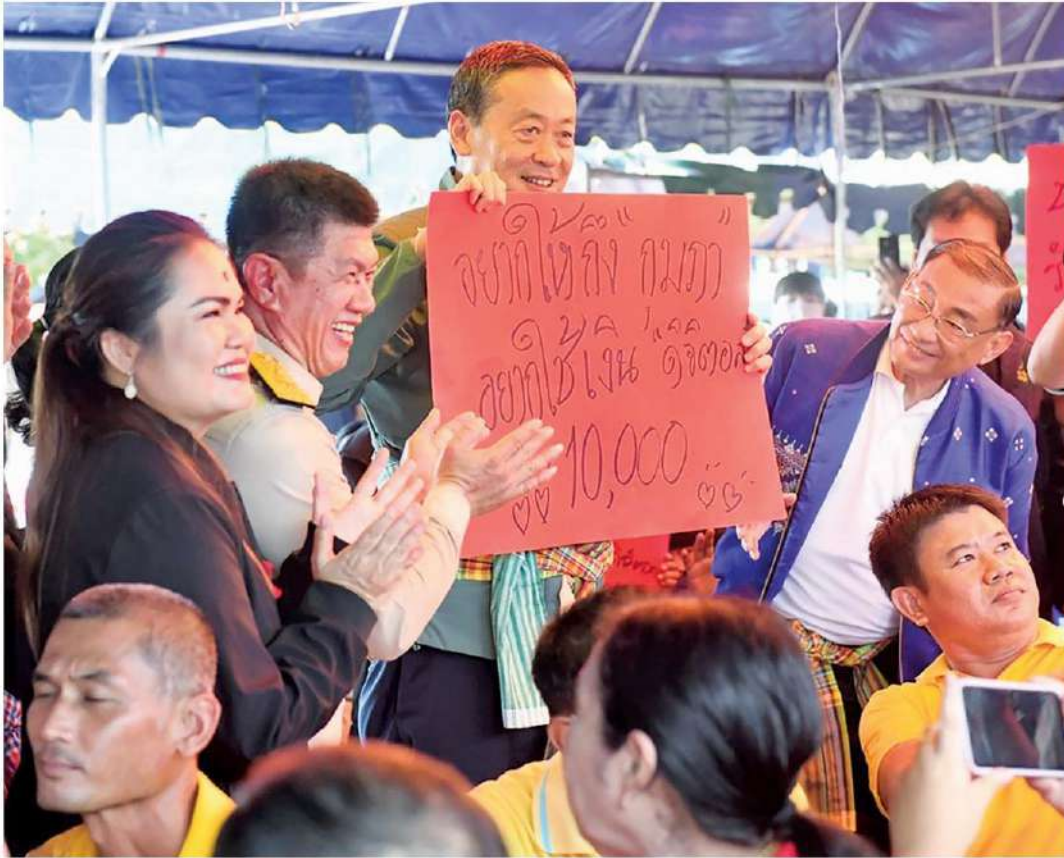
🏠 หนุน 1 หมื่น - นายเศรษฐา ทวีสิน นายกรัฐมนตรี พบปะเยี่ยมเยียนประชาชนและตรวจสถานการณ์น้ำท่วม จ.พิษณุโลก โดยมีชาวบ้านแห่มาต้อนรับพร้อมชูป้ายสนับสนุนโครงการดิจิทัล วอลเล็ต 1 หมื่นบาท เมื่อวันที่ 14 ต.ค.

หัวข้อข่าว: นายกฯชวนกำลังใจดิจิทัล1หมื่น