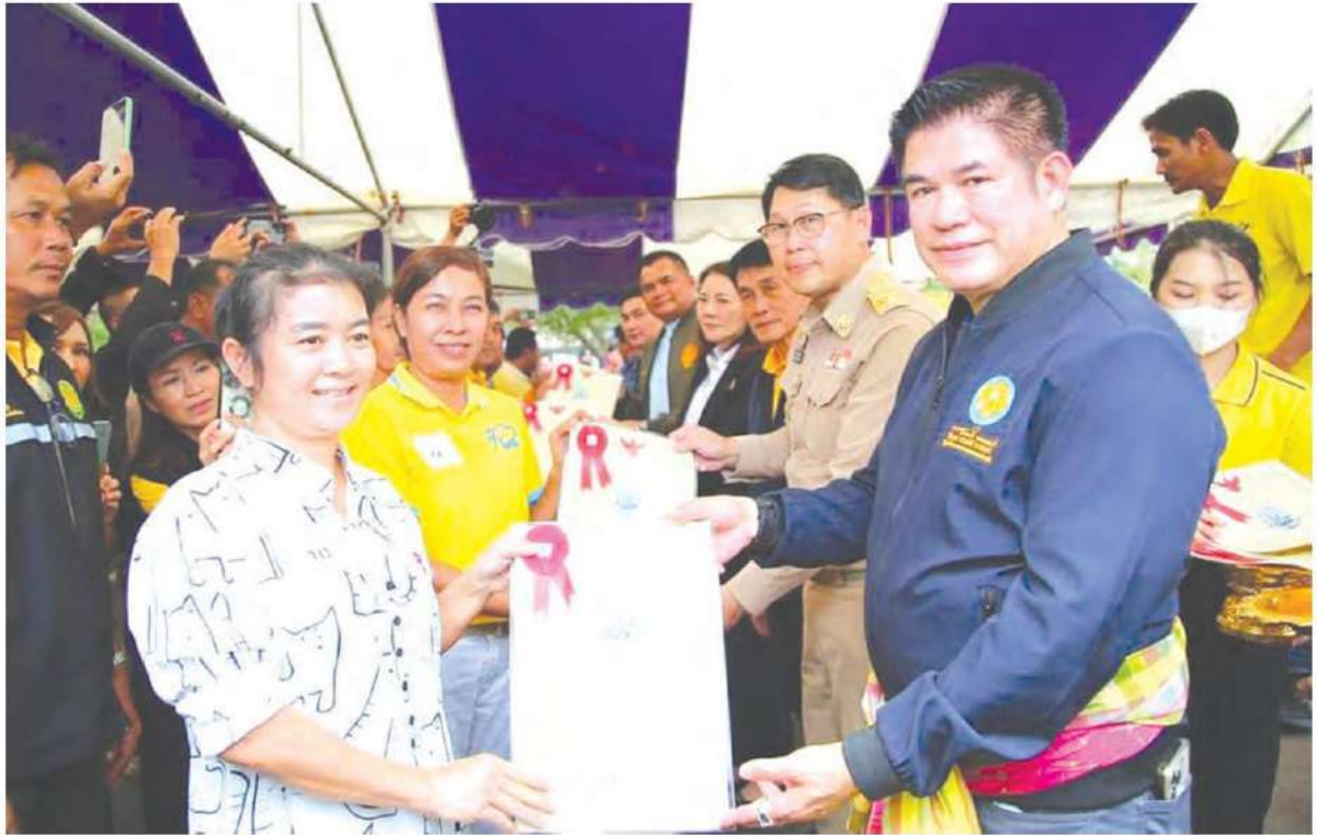
ร.อ.ธรรมนัส พรหมเผ่า รัฐมนตรีว่าการกระทรวงเกษตรและสหกรณ์ เป็นประธานมอบหนังสืออนุญาตให้เข้าทำประโยชน์ในเขตปฏิรูปที่ดิน หรือ ส.ป.ก.4-01 ให้กับเกษตรกร จ.นครสวรรค์

เลขาธิการ ส.ป.ก. ระบุว่า ที่ผ่านมาการถือครองที่ดิน ส.ป.ก. ไม่สามารถเข้าถึงแหล่งเงินทุนได้ ไม่สามารถใช้เป็นหลัก ทรัพย์สินค้ำประกันเงินกู้ได้ ยกเว้นกับธนาคารเพื่อการเกษตรและ สหกรณ์การเกษตร (ธ.ก.ส.) แต่ก็ให้สินเชื่อได้เพียง 50% ของ ราคาประเมิน เกษตรกรที่ถือครองที่ดิน ส.ป.ก. จึงมีข้อจำกัด ในการลงทุน ส่งผลให้ผลตอบแทนจากการเกษตรลดลงกว่าที่ ควรจะเป็น หรือจำเป็นต้องไปกู้เงินจากแหล่งเงินกู้นอกระบบ เพิ่มขึ้นด้วย ขณะที่ ส.ป.ก. ยังมีสิทธิที่การเข้าไปพัฒนาโครงสร้าง พื้นฐานต่างๆ ร่วมกับหน่วยงานที่เกี่ยวข้อง รวมทั้งการ ตรวจสอบการใช้ประโยชน์ในพื้นที่ ซึ่งเป็นเรื่องที่ดีกว่าเมื่อเทียบกับผู้ถือครองโฉนดที่ดินของกระทรวงมหาดไทย