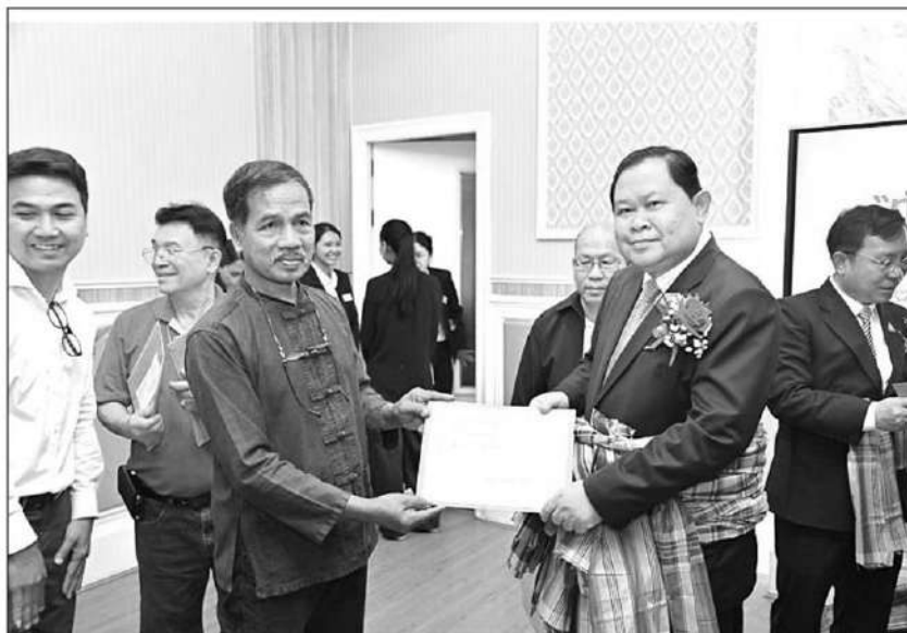
เร่งปราบ : นายไชยา พรหมา รมช.เกษตรและสหกรณ์ รับมอบหนังสือจากตัวแทนกลุ่มเกษตรกรผู้เลี้ยงสุกรรายย่อย ซึ่งขอให้แก้ปัญหาการลักลอบนำเข้าเนื้อสุกรแช่แข็งผิดกฎหมาย การระบาดของโรคอหิวาต์แอฟริกาในสุกร นอกจากนี้จะตั้งคณะกรรมการในการศึกษาเรื่องการผลิตวัคซีนป้องกันโรคระบาดด้วย

สำหรับแนวทางการเร่งแก้ไข ปัญหา อุปสรรค จากข้อเรียกร้องของกลุ่มเกษตรกรรายย่อย ในประเด็นโรคระบาดในสัตว์นั้น จะตั้งคณะกรรมการในการศึกษาเรื่องการผลิตวัคซีนป้องกันโรคระบาดให้แก่เกษตรกรรายย่อย เพื่อเป็นการลดการพึ่งพาวัคซีนจากต่างประเทศรวมถึงแนวทางการสร้างโอกาสให้แก่เกษตรกรรายย่อย มีช่องทางจำหน่ายในประเทศมากขึ้น ตามนโยบายด้านเกษตรกรรม “ตลาดนำ นวัตกรรมเสริมเพิ่มรายได้” โดยนายเศรษฐา ทวีสิน นายกรัฐมนตรี และ รมว.คลัง ใช้กลไกอื่นๆ ร่วมด้วย เพื่อให้เกิดประสิทธิภาพ อาทิ การเข้ามาดูแลด้านราคาผลผลิตเกษตรกรให้เป็นธรรม การเพิ่มโอกาสทางการค้าและกลไกตลาดโดยอาศัยความร่วมมือระหว่างภาครัฐและเอกชน เป็นต้น