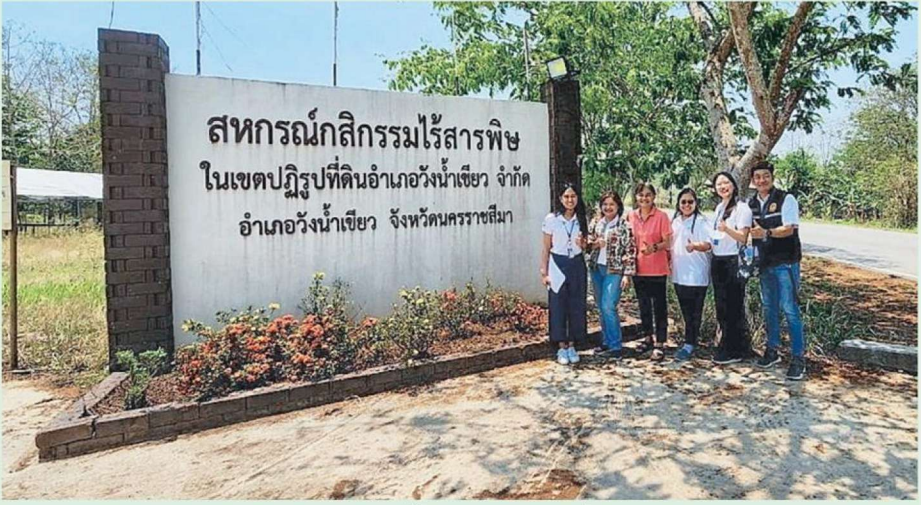
เจ้าหน้าที่ภายใต้แบรนด์ กสิกรรมไร้สารพิษ วังน้ำเขียว"

"เกษตรกรมีการเพาะปลูกผักอินทรีย์รวมกว่า 120 ชนิด ปลูกหมุนเวียนและเก็บผลผลิตได้ตลอดทั้งปี แหล่งเพาะปลูกส่วนใหญ่อยู่ใกล้แหล่งต้นน้ำ มีอากาศดี เหมาะแก่การเจริญเติบโตของพืชผักส่วนใหญ่ และไม่ค่อยประสบปัญหาภัยแล้ง ผักอินทรีย์ที่ผู้บริโภคนิยมและสร้างผลตอบแทนให้เกษตรกรได้มากที่สุด 10 ชนิดแรก ได้แก่ สลัดไอ้แดง สลัดไอ้เขียว สลัดคอส กะหล่ำปลี ผักกาดขาวปลี ผักกาดหอมใบแดง ผักบุ้งจีน ยอดมะระแม้ว ข้าวโพดหวาน และแตงกวา โดย