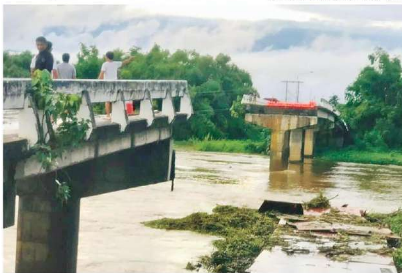
◀ ซัดสะพานขาด - สะพานวังสะแกง ข้ามแม่น้ำปิง เชื่อมระหว่าง อ.เวียงหนองล่อง จ.ลำพูน กับ อ.จอมทอง จ.เชียงใหม่ ถูกกระแสน้ำที่ ไหลเชี่ยวกรากซัดที่ตอนกลางของสะพานหักทลายพังลงมา เจ้าหน้าที่ต้อง รีบปิดการจราจร โชคดีขณะเกิดเหตุไม่มีผู้สัญจรผ่าน เมื่อวันที่ 30 ก.ย.

ทั้งนี้ แม้เป็นช่วงวันหยุดราชการและหาก จำเป็นต้องประกาศพื้นที่ภัยพิบัติ เพื่อให้ เจ้าหน้าที่เข้าไปยังพื้นที่ หรือมีการใช้จ่าย งบประมาณในการช่วยเหลือประชาชน