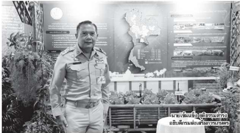
นายเข้มแข็ง ยุติธรรมดำรง อธิบดีกรมส่งเสริมการเกษตร

ปัจจุบันมีกลุ่มยุทธศาสตร์ไทย 4,930 กลุ่ม สมาชิก 82,445 ราย แบ่งเป็น กลุ่มยุทธศาสตร์ไทยในสถาบันการศึกษา ตั้งแต่ระดับประถมศึกษา จนถึงอุดมศึกษา 4,860 กลุ่ม กลุ่มยุทธศาสตร์ไทย