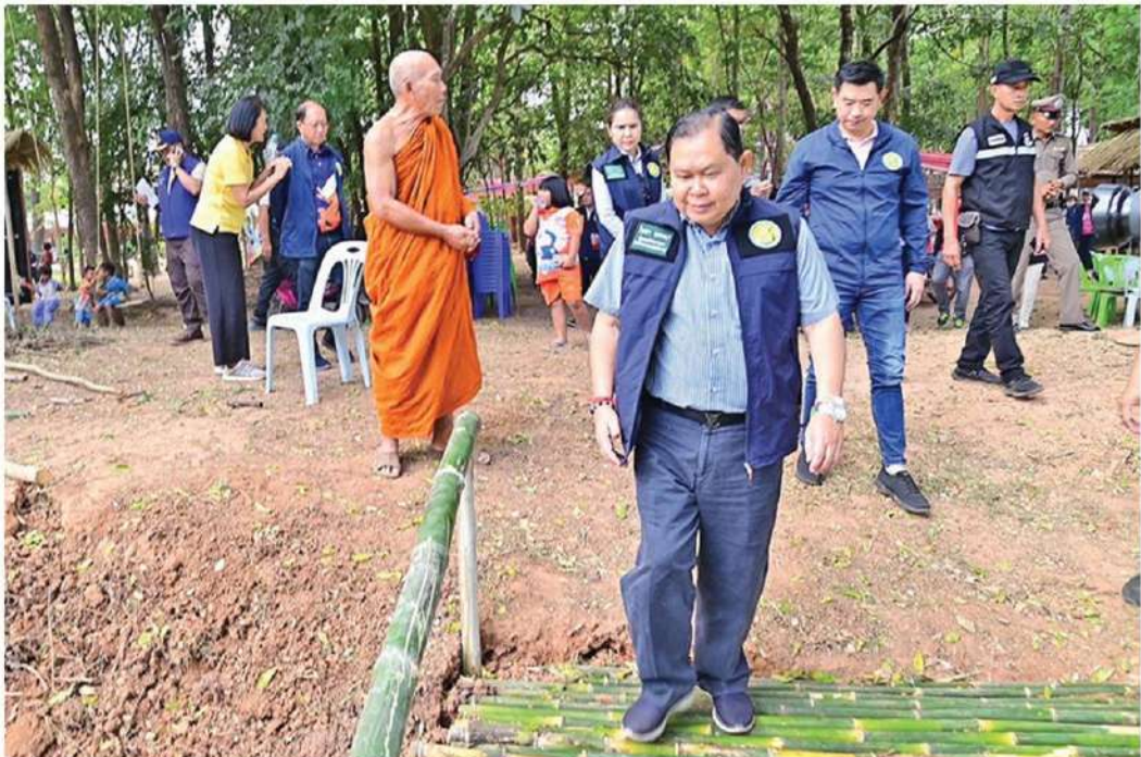
พร้อมรับ'เศรษฐา' - นายไชยา พรหมา รัฐมนตรีช่วยว่าการกระทรวงเกษตรและสหกรณ์ ลงตรวจความเรียบร้อย สถานที่ต่างๆ เพื่อเตรียมต้อนรับนายเศรษฐา ทวีสิน นายกรัฐมนตรีและรัฐมนตรีว่าการกระทรวงการคลัง มาตรวจราชการ และประชุม กรม.สัญญาครั้งแรกที่ จ.หนองบัวลุ่ม เมื่อวันที่ 2 ธันวาคม

โปรดเกล้าฯให้ พล.อ.ประยุทธ์ องคมนตรี เข้าเฝ้าฯถวายสัตย์ ปฏิญาณตนก่อนเข้ารับหน้าที่ 'กรม. สัญญา'วันนี้หนองบัวลุ่มตั้งแทนชง 81 โปรเจกต์แก้งนของบ'เศรษฐา' 7.4 พันล้าน 'ไชยา'ลงพื้นที่โชว์ โมเดล 3 ก. 'ราเมศ'มั่นใจได้ หน.ปชป. คนใหม่ 9 ธ.ค. (อ่านต่อหน้า 15)