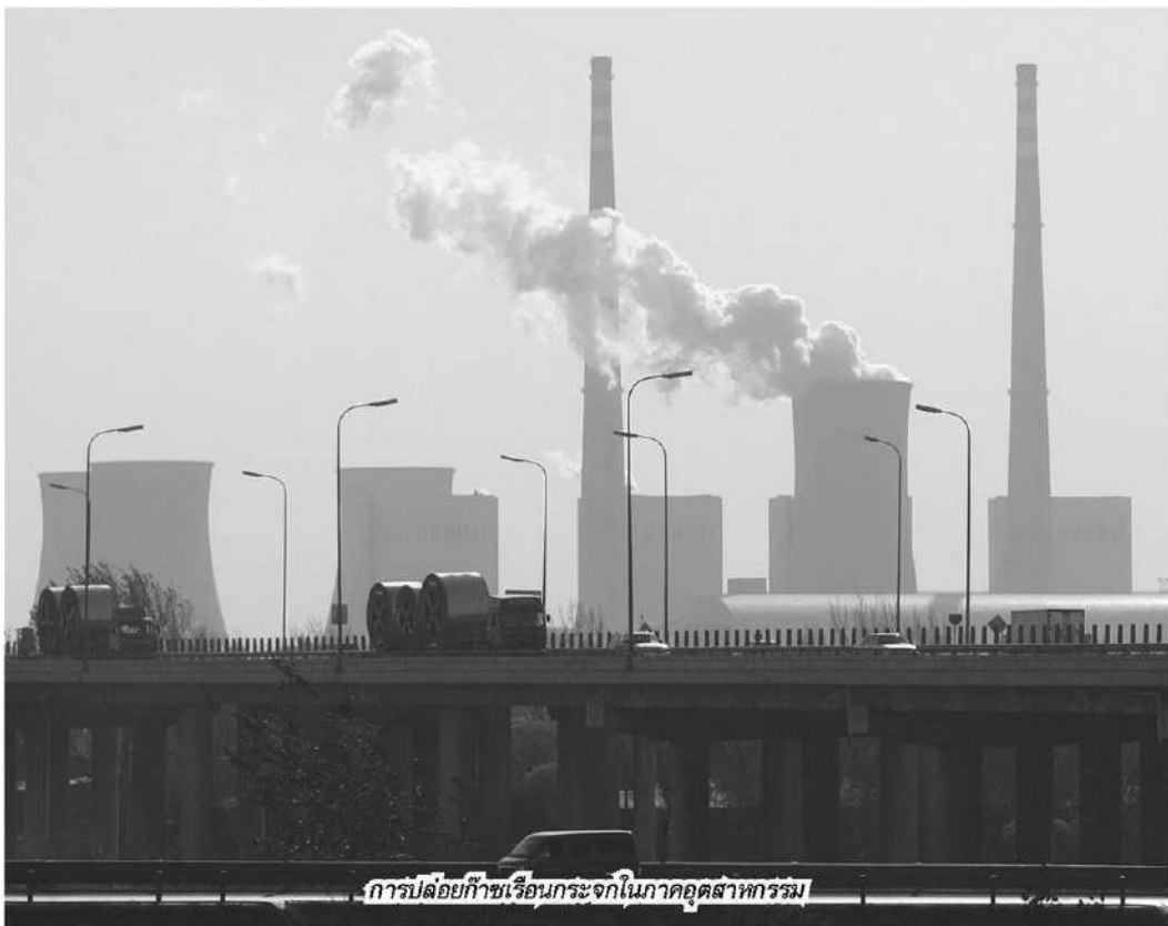
การปล่อยก๊าซเรือนกระจกในภาคอุตสาหกรรม

ก การประชุมลดคาร์บอนโลก COP 28 ที่ประเทศดูไบเริ่มขึ้นแล้วเมื่อวันที่ 30 พ.ย.2566 เวทีนี้มีตัวแทนจากรัฐบาลไทยเข้าร่วมเพื่อนำเสนอนโยบายและความก้าวหน้าการทำงานแก้ปัญหาโลกร้อน ซึ่งตอนนี้กลายเป็นโลกเดือดแล้ว ภาคประชาสังคมจัดเวทีในการพูดคุยแลกเปลี่ยนทางความคิดสำหรับทุกฝ่ายที่เกี่ยวข้อง “วิเคราะห์ข้อท้าทายเจรจา ลดโลกร้อน COP 28” ภายใต้โครงการ “Dialogue Forum” เมื่อวันก่อน เพื่อเป็นพื้นที่พูดคุยแลกเปลี่ยนข้อมูลข้อเท็จจริง รวมทั้งข้อคิดเห็นต่างๆ ของทุกฝ่ายในประเด็นที่กำลังอยู่ในความสนใจของสังคม โดยเฉพาะประเด็นเชิงนโยบายทางด้านสังคมและสิ่ง