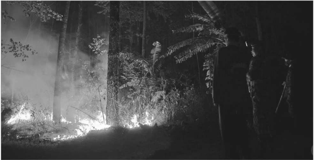
ไฟที่ลี้กลอบเผาในป่า ก่อฝุ่นควันพิษในภาคเหนือ