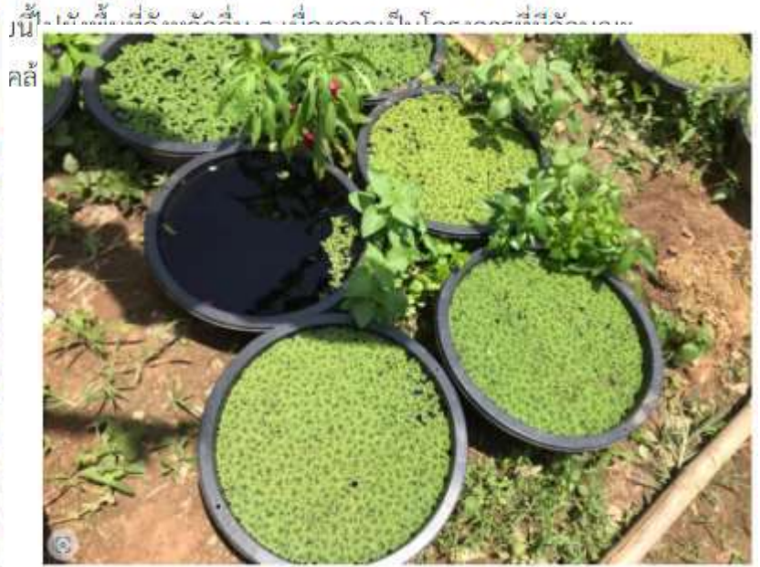
นี่คือพืชทางเลือกที่เกษตรกรได้ปลูกในพื้นที่นาลุ่มต่ำ