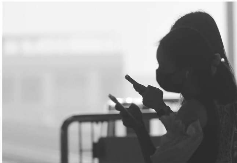
ฝุ่น PM 2.5 บัญหามลพิษอากาศที่เผชิญทุกฤดูฝุ่น