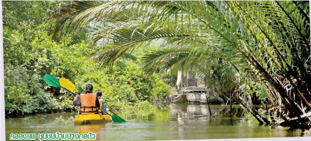
คลองเขื่อน เขมรบ้านบางกอบัว