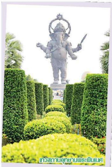
สวนสวนอุทยานพระพิฆเนศ

คำว่า "คลองเขื่อน" ถูกปรับมาจากคำว่า "คลองเขิน" ตามลักษณะคลองแห่งหนึ่งในชุมชนที่ต้นเขิน ภายหลังได้ถูกเปลี่ยนเป็นคลองเขื่อนเพื่อความไพเราะ ชุมชนนี้แยกตัวออกมาจากอำเภอบางคล้า และถูกยกฐานะให้เป็นอำเภอเมื่อปี 2550 มีชื่อเสียงโด่งดังในเรื่องการปลูกมะม่วงรสชาติดีอันคับคั่ง ๆ ของประเทศไทย และยังเป็นสินค้าที่ได้รับมาตรฐาน GI ส่งออก