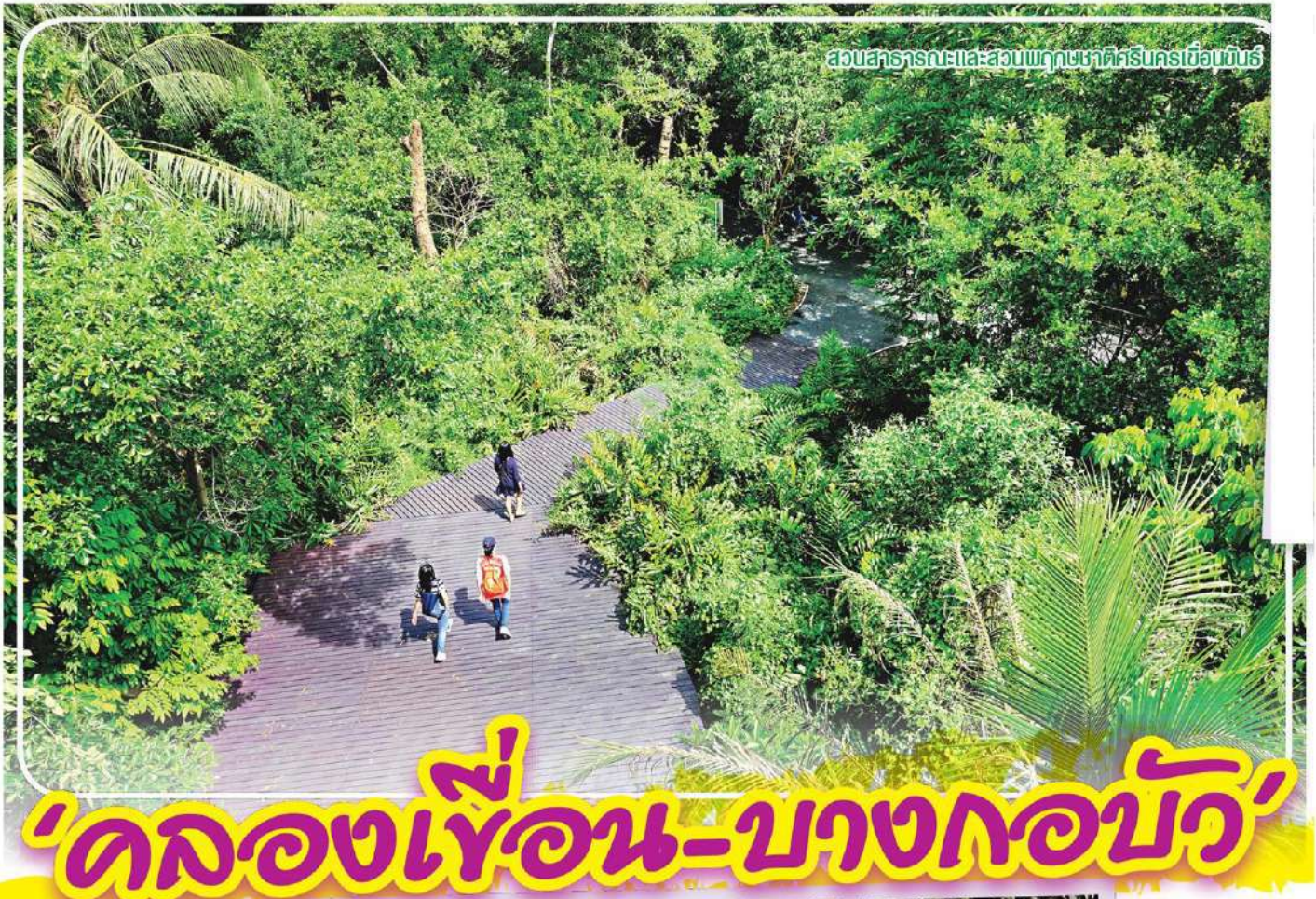
สวนสาธารณะและสวนพฤกษศาสตร์ศรีนครเขื่อนขันธ์