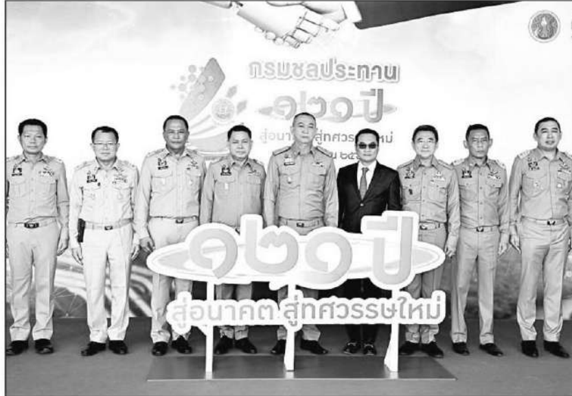
ร่วมงาน : ดร.เฉลิมชัย ศรีอ่อน รว.เกษตรและสหกรณ์ ร่วมงาน “121 ปี กรมชลประทาน ส่วนภาคสุกสวรสฯใหม่” โดยเน้นย้ำเรื่องการเพิ่มแหล่งน้ำต้นทุน การบริหารจัดการน้ำอย่างมีประสิทธิภาพ ตลอดจนใช้น้ำให้เกิดคุณค่า สร้างความมั่นคงด้านน้ำ และเร่งรัดโครงการที่จำเป็นต้องดำเนินการให้แล้วเสร็จ