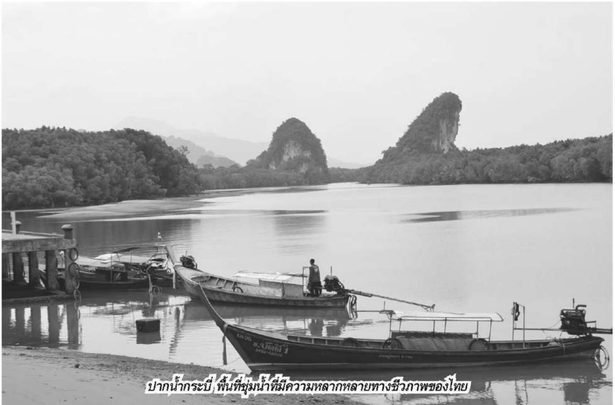
ปากน้ำกระเป๋มี พื้นที่ชุ่มน้ำที่มีความหลากหลายทางชีวภาพของไทย

แ มัชจะมีข้อมูลความหลากหลายทางชีวภาพประกอบด้วยพืช สัตว์ จุลินทรีย์ ชนิดพันธุ์ที่ถูกคุกคาม ชนิดพันธุ์ต่างถิ่นที่รุกราน ที่เกิดสิ่งมีชีวิต จำนวน 1.2 แสนรายการบนระบบคลังข้อมูล ความหลากหลายทางชีวภาพของประเทศไทย (Thailand Biodiversity Information Facility: TH-BIF) ซึ่งเป็นแพลตฟอร์มดิจิทัลที่สำนักงานนโยบายและแผนทรัพยากรธรรมชาติและสิ่งแวดล้อม (สผ.) พัฒนาขึ้น แต่บิกดาต้านี้ก็ยังไม่ครอบคลุมข้อมูลเกี่ยวกับพื้นที่ชุ่มน้ำและความหลากหลายทางชีวภาพในพื้นที่ชุ่มน้ำสำคัญที่มีกว่า 130 แห่งกระจายทั่วทุกภาคในประเทศไทย ซึ่งส่งผลกระทบต่อการตัดสินใจวางแผนในการอนุรักษ์ พื้นที่ และใช้ประโยชน์พื้นที่ชุ่มน้ำอย่างยั่งยืน ปฏิเสธไม่ได้ว่าทุกวันนี้พื้นที่ชุ่มน้ำของไทยตกอยู่ในภาวะถูกคุกคามจากการบุกรุกทำลาย และกิจกรรมการพัฒนาในรูปแบบต่างๆ