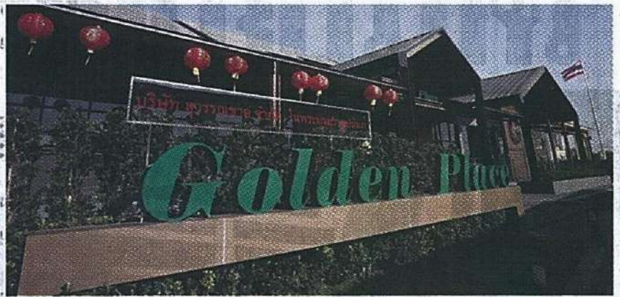
โกลเด้น เพลซ เปิดสาขาใหม่ สาขานครสวรรค์ โดยนับเป็นสาขาลำดับที่ 21 นับตั้งแต่เปิดสาขาแรก เมื่อวันที่ 1 ก.พ. 2544

พื้นที่โซนซูเปอร์มาร์เกต มีผักและผลไม้สดคุณภาพดีให้เลือกสรร