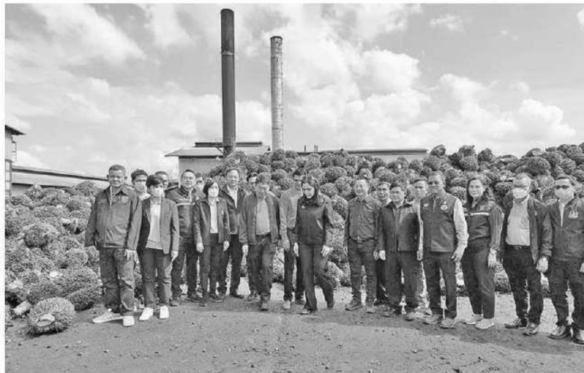
ตรวจป่าลัม - น.สมณัญญา ไทยเศรษฐ์ รัฐมนตรีช่วยว่าการกระทรวงเกษตรและสหกรณ์ ลงพื้นที่เยี่ยมชม การดำเนินงานของชุมชนสหกรณ์ชาวสวนปาล์มน้ำันกระษี จำกัด ที่ อ.อ่าวลึก จ.กระบี่ เมื่อวันที่ 21 มกราคม