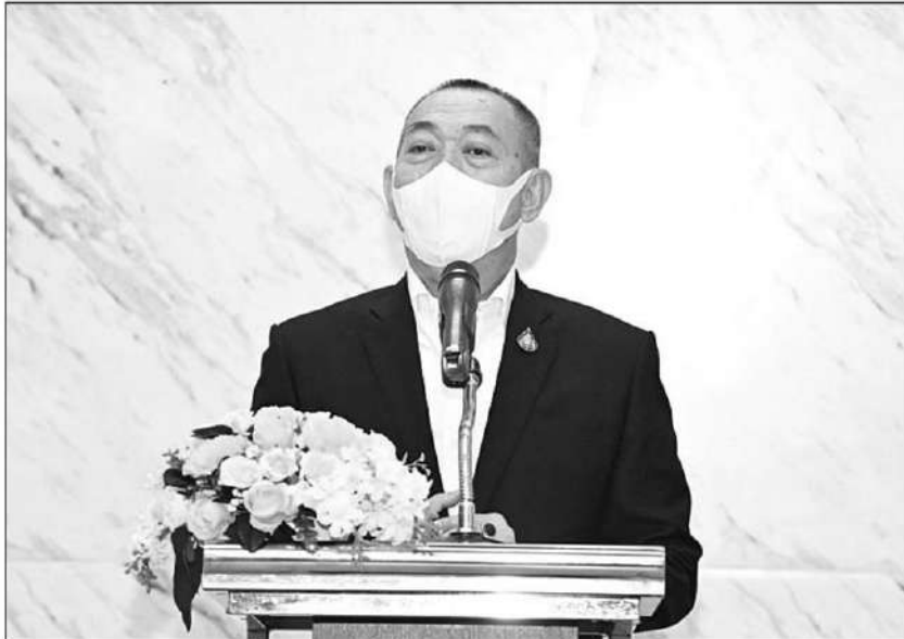
มอบนโยบาย : ดร.เฉลิมชัย ศรีอ่อน รมว.เกษตรและสหกรณ์ มอบนโยบายผู้บริหารกรมส่งเสริมการเกษตร ในโอกาสเข้ารับตำแหน่งปีงบประมาณ 2566 เน้นย้ำถึงยุทธศาสตร์ของกระทรวงเกษตรฯ บูรณาการการทำงานร่วมกับหน่วยงานที่เกี่ยวข้อง นำนโยบายไปสู่การปฏิบัติได้จริงและเข้าถึงเกษตรกร