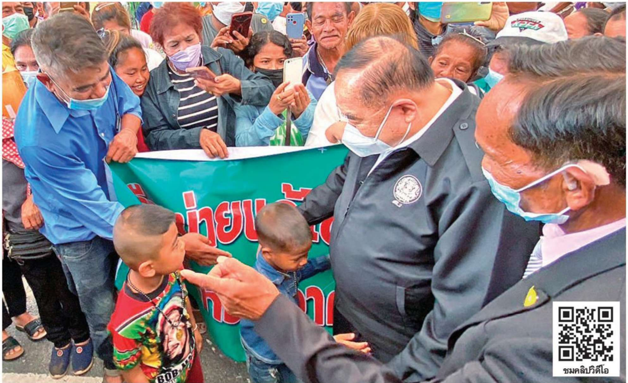
ชกอด - พล.อ.ประวิตร วงษ์สุวรรณ รองนายกรัฐมนตรี หัวหน้าพรรคพลังประชารัฐ พร้อมคณะ ลงพื้นที่ติดตามสถานการณ์น้ำและปาล์มน้ำมัน โดยมีประชาชนมารอต้อนรับ และมีลูกหลานชาวบ้านเข้ามาขอสวมกอด บรรยากาศเป็นไปอย่างคึกคัก ที่ศาลากลางจังหวัดสุราษฎร์ธานี เมื่อวันที่ 17 ตุลาคม

แห่งชาติ (กปน.) ได้เดินเยี่ยมชมนิทรรศการ การบริหารจัดการปาล์มน้ำมัน พร้อมพบปะ ประชาชนและพูดคุยกับเกษตรกรผู้ปลูกปาล์ม น้ำมัน พร้อมกล่าวว่า ในฐานะที่เป็นประธาน กปน.ได้ดูแลแก้ไขปัญหาปาล์มล้นตลาดและ ราคาปาล์มตกต่ำมาโดยตลอดจนสำเร็จเป็นรูปธรรมในช่วง 3 ปีที่ผ่านมา การนำน้ำมันปาล์มดิบในสต็อกส่วนเกิน จำนวน 3.6 แสนตัน ไปผลิตไฟฟ้าก็มาจากความคิดของตน ทำให้ราคาปาล์มสูงขึ้น โดยตั้งแต่ปี 2562 ราคาปาล์ม น้ำมันไม่เคยต่ำกว่า 4 บาทเลย จนตอนนี้ขึ้นมาจากบาททกว่ามาถึง 8 บาทกว่า คาดว่าทั้งปีน่าจะอยู่ที่ 7.50 บาทถึง 8 บาท ภาคใต้ปลูกปาล์ม น้ำมันมากทำให้เงินสพัดและเศรษฐกิจดี จากนี้จะให้ทีมงานออกมาตรการระยะยาว คือการแปรรูปให้ปาล์มเป็นพืชเศรษฐกิจที่ยั่งยืน ถ้าวินเห็นหน้าได้แล้ว จึงต้องบอกกับชาวสวนปาล์มว่าขอให้รับทราบว่าได้พยายามทำทุกอย่างเพื่อให้ราคาปาล์มไม่ต่ำกว่า 8 บาทต่อกิโลกรัม รัฐบาลไม่ได้นิ่งดูตายที่จะช่วยเหลือชาวปาล์ม น้ำมัน ไม่ว่าจะอยู่จังหวัดอะไรก็แล้วแต่ของภาคใต้ รัฐบาลพยายามทำให้ราคาไม่ต่ำกว่านี้ และจะทำให้สูงกว่านี้ต่อไป