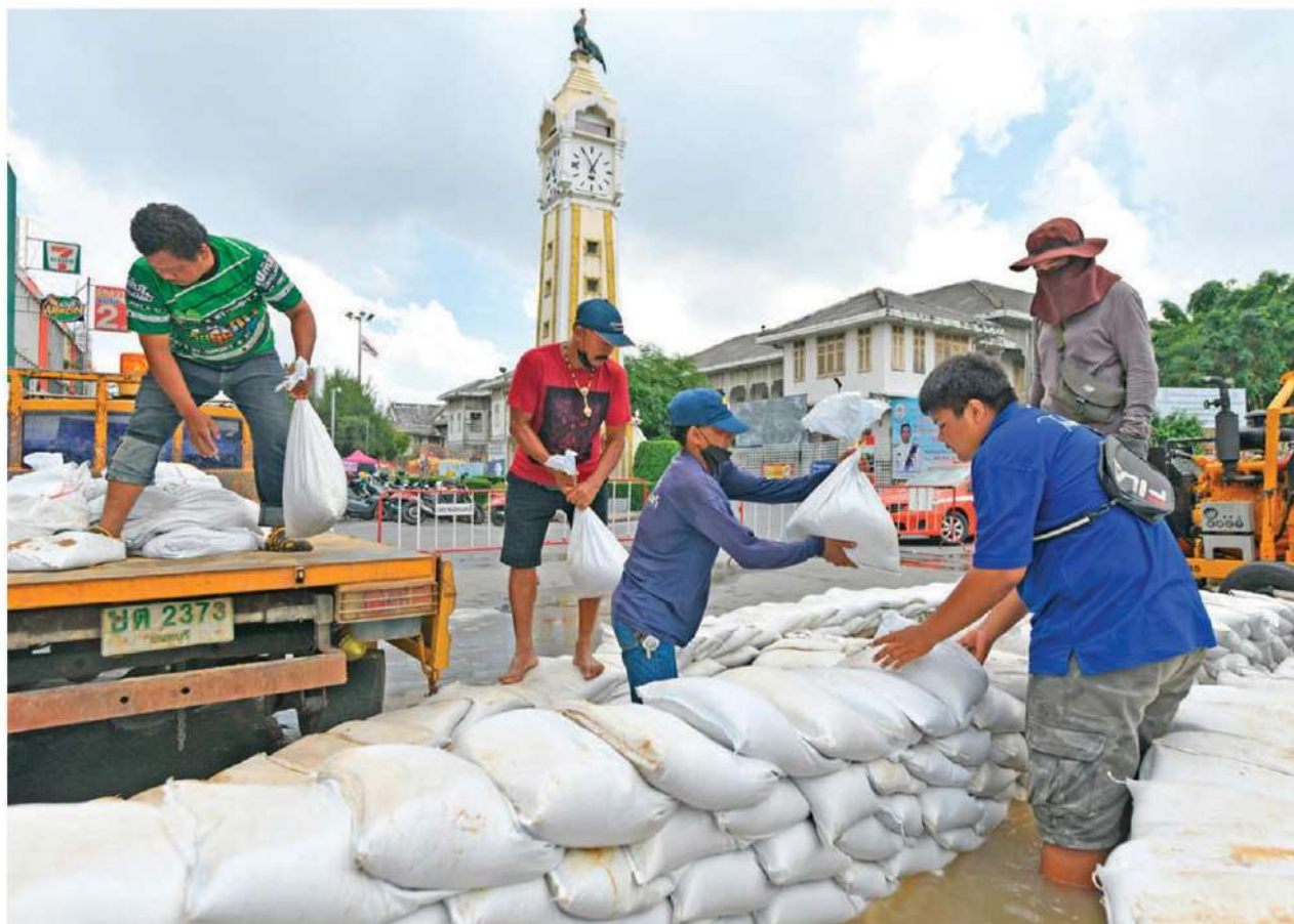
เสริมกระสอบทราย - สถานการณ์แม่น้ำเจ้าพระยาหนุนสูงส่งผลกระทบต่อหลายอำเภอใน จ.นนทบุรีถูกน้ำท่วม เจ้าหน้าที่นำกระสอบทรายมาเสริมบริเวณหอนาฬิกา ศาลากลางหลังเก่า เพื่อป้องกันเขตเศรษฐกิจตลาดเทศบาลเมืองนนทบุรีไม่ให้น้ำทะลักเข้าท่วม เมื่อวันที่ 12 ตุลาคม

ผู้สื่อข่าวรายงานว่า ที่บริเวณสะพานข้ามทางรถไฟ บ้านหนองบัวไชยวาน ต.โนนสัง อ.กันทรารมย์ จ.ศรีสะเกษ พล.อ.ประวิตร วงษ์สุวรรณ รองนายกรัฐมนตรี เดินทางตรวจติดตามการแก้ปัญหาอุทกภัยในพื้นที่ จ.ศรีสะเกษ พร้อมตรวจ