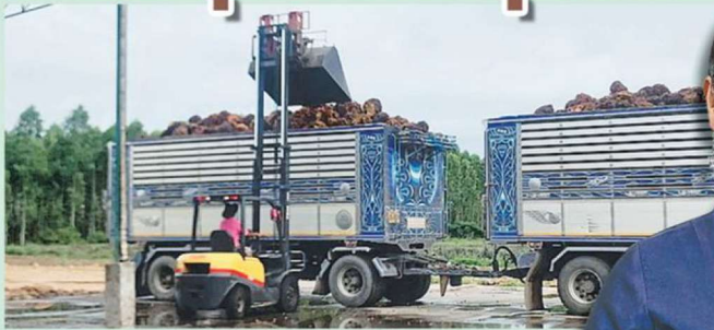
ลานเคลื่อนที่ ขนาด 17 ตัน และรถยกไฟร์คลิฟต์”

ปัจจุบันพื้นที่ปลูกรวม 734 ไร่ เฉลี่ยครัวเรือน ละ 19.3 ไร่ มีสมาชิก 38 ราย ทางกลุ่มมี การบริหารจัดการแปลงอย่างมีประสิทธิภาพ มุ่งขยายผลยกระดับศักยภาพการผลิตการ ตลาด ด้วยการเสนอแผนยกระดับศักยภาพ สามารถเข้าร่วมโครงการยกระดับแปลงใหญ่ ด้วยเกษตรสมัยใหม่และเชื่อมโยงตลาด ปี 2564 ของกระทรวงเกษตรฯ ภายใต้งบประมาณ ในโครงการแก้ไขปัญหา เชื้อยา และฟื้นฟู เศรษฐกิจและสังคม ที่ได้รับผลกระทบจาก สถานการณ์การระบาดของโรคติดเชื้อไวรัส โคโรนา 2019 และได้รับการสนับสนุน รวบรวม ผลผลิตพร้อมอาคารสำนักงาน ชุดซังน้ำหนัก ขนาด 50 ตัน พร้อมอุปกรณ์เครื่องจักร คัมพ์