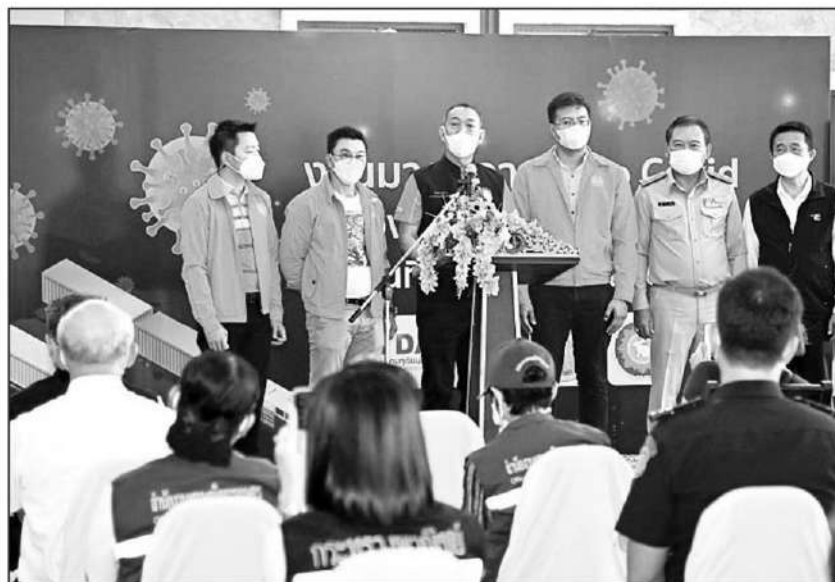
เน้นย้ำ : ดร.เฉลิมชัย ศรีอ่อน รมว.เกษตรและสหกรณ์ เปิดงานมาตรการ Zero COVID เน้นย้ำระบบห้องเย็นผลไม้ทั้งระบบ ดูแลให้ปลอดภัยไวรัสโควิด-19 โดยเฉพาะทุเรียนผลไม้ที่สร้างรายได้ให้ประเทศไทย

อันดับ 1 ให้กับประเทศไทย ปีละกว่าแสนล้านบาท เพราะทุเรียนไทยมีคุณภาพที่ดีที่สุดในโลก โดยจีนเป็นตลาดส่งออกอันดับ 1 ของไทย แต่จากสถานการณ์แพร่ระบาดของไวรัสโควิด-19 ทำให้การส่งออกทุเรียนได้รับผลกระทบ แต่สามารถแก้ไขปัญหาดังกล่าวได้ทันเวลาที่เพราะทุกฝ่ายร่วมมือกัน ดังนั้น จึงขอให้เกษตรกร ล้ง หน่วยงานราชการ ทำงานและร่วมมือกันทำให้ทุเรียนไทยเป็นที่ยอมรับในต่างประเทศ ขณะเดียวกันได้เน้นย้ำให้มีการส่งเสริมการขายภายในประเทศ ซึ่งประเทศไทยมีความเข้มงวดในการดำเนินมาตรการ Zero COVID และใช้มาตรการ GAP Plus ที่สวนทุเรียน และ GMP Plus ที่ล้ง เพื่อให้มั่นใจได้ว่าทุเรียนไทยทุกลูกต้องมีความปลอดภัย หากเราเดินในแนวทางเดียวกันก็จะไม่เกิดปัญหา จึงขอฝาก ผวจ.จันทบุรี และหน่วยงานที่เกี่ยวข้อง ให้เดินหน้ามาตรการต่างๆ เพื่อเตรียมรับมือผลผลิตผลไม้อื่นๆ ที่จะออกในช่วงนี้