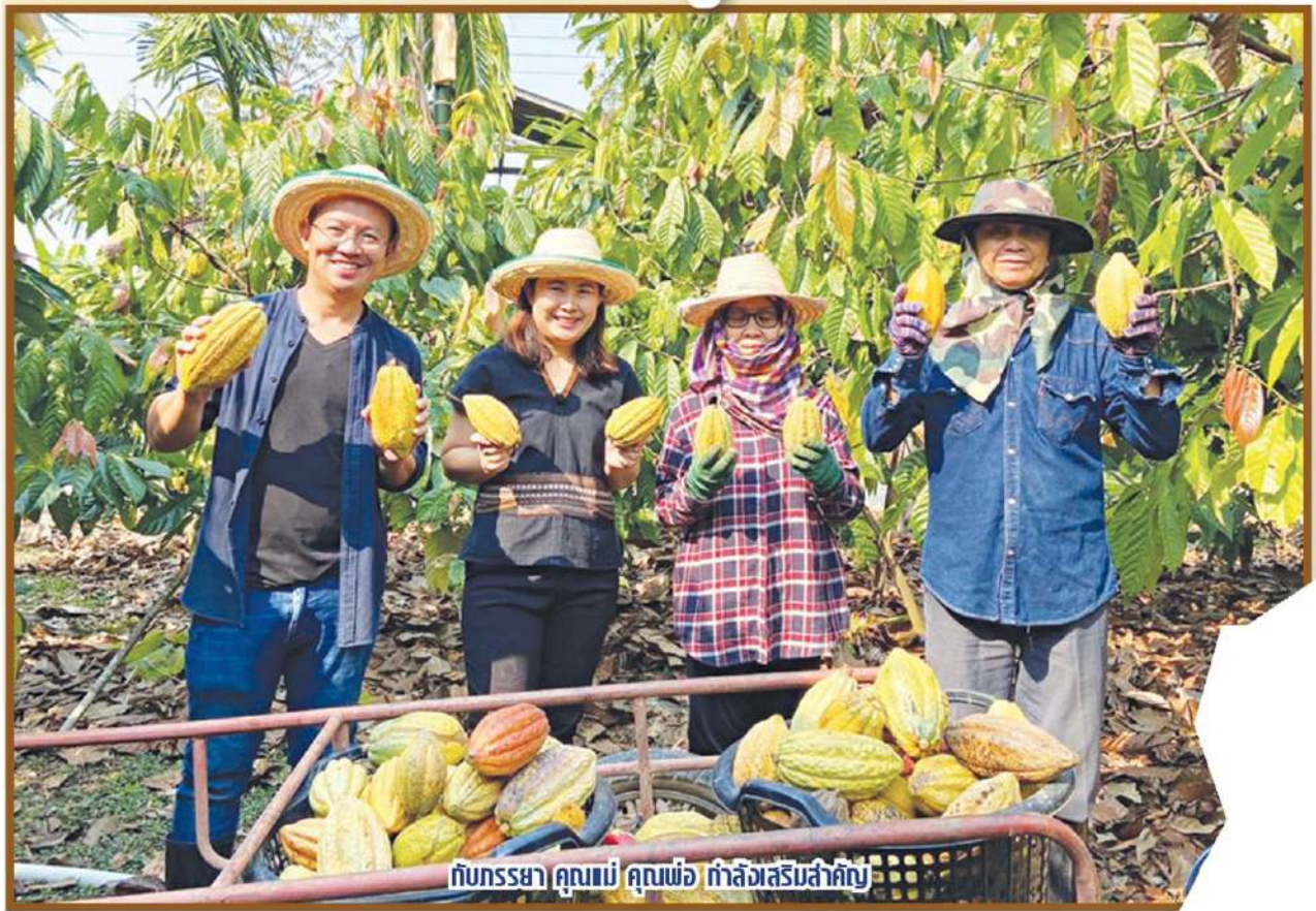
กับภรรยา คุณแม่ คุณพ่อ กำลังเสริมสำคัญ

เทคโนโลยีและเทคนิคแปรรูปโกโก้ จะทำให้ได้โกโก้และช็อกโกแลตชั้นดีนั้นจะต้องทำอย่างไร แล้วนำเอาความรู้ที่ได้เหล่านี้มาพัฒนาการปลูกและแปรรูปที่สวนของเรา” เขาเล่า