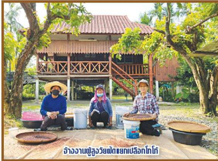
จ้างงานผู้ล้วยพัฒนเกษตรปลูกโกโก้