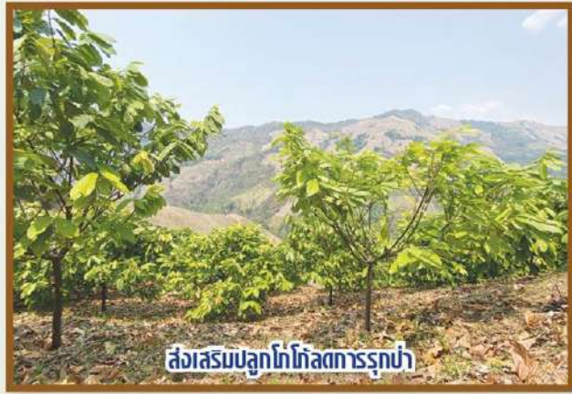
ส่งเสริมปลูกโกโก้การรุกป่า

และเล่าให้ฟังอีกว่า เขาได้ถ่ายทอดองค์ความรู้การปลูกโกโก้ให้เกษตรกรท้องถิ่น และส่งเสริมให้ชุมชนหันมาปลูกโกโก้แบบอินทรีย์ โดยรับซื้อผลผลิตในราคาที่สูงเพื่อสร้างรายได้ให้กับเกษตรกรในชุมชน อีกทั้งเขายังนำประสบการณ์ที่มีไปแบ่งปันให้คนรุ่นใหม่ที่มีใจทำการเกษตรผ่าน โครงการ "New Gen Hug บ้านเกิด" ที่ทาง ธ.ก.ส. หรือ ธนาคารเพื่อการเกษตรและสหกรณ์การเกษตร จัดทำ