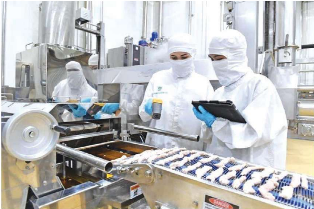
โรงงานแปรรูปใก่เนื้อของซีพีเอฟ จำนวน 5 แห่ง ได้รับอนุญาตให้ส่งออกไปยังประเทศซาอุดีอาระเบีย

คนซาอุฯมาเที่ยวไทยตามเป้าสองแสนคน ททท.และภาคเอกชนคงต้องออกแรงแข็งขันไม่น้อย เพื่อให้บรรลุเป้าหมาย