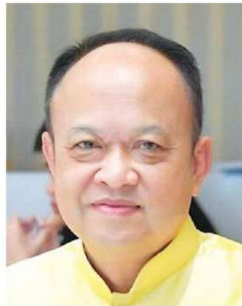
ทองเปลว กองจันทร์

“กระทรวงไม่ได้มีนงอนใจ จะต้องดำเนินการผลักดันการส่งออกผลไม้ไปจีนให้ได้ พร้อมทั้งหาลาดใหม่รองรับโดยล่าสุดได้ประสานไปยังทูตเกษตรเพื่อหาแนวทางลดปัญหาการแออัดในการส่ง