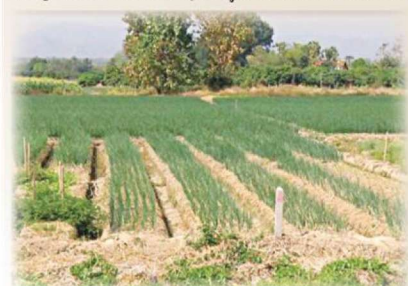
2565) รวม 3,765 ราย เกษตรกรจะเริ่มทยอยปลูกในเดือนกรกฎาคม-พฤศจิกายน (ระยะเวลา

สำหรับการเพาะปลูกหอมหัวใหญ่ ปัจจุบันมีจำนวนเกษตรกรเพาะปลูกหอมหัวใหญ่ ทั้ง 3 จังหวัด (ข้อมูล ณ เดือนมกราคม