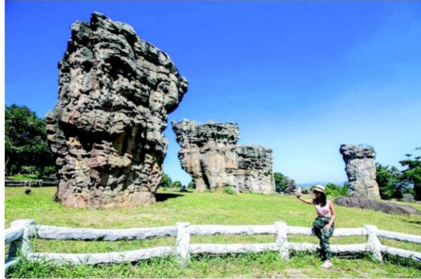
มอหินขาว จังหวัดชัยภูมิ

ส่วนจังหวัดชัยภูมิ ก็มีสิ่งที่เป็นไฮไลต์ทางธรรมชาติมากมาย อาทิ อุทยานแห่งชาติป่าหินงาม ชมผาห้าหล่ม และอุทยานแห่งชาติไทรทอง, มอหินขาว อุทยานแห่งชาติภูแล่นคา, น้ำตกตาดโตน อุทยานแห่งชาติตาดโตน ซึ่งมีน้ำตกตลอดทั้งปี, เขตรักษาพันธุ์สัตว์ป่าภูเขียว-ทุ่งกะมัง ที่มีสัตว์ป่าอาศัยชุกชุม เช่น เก้ง กวาง กระเจิง เนื้อทราย และนกนานาชนิด