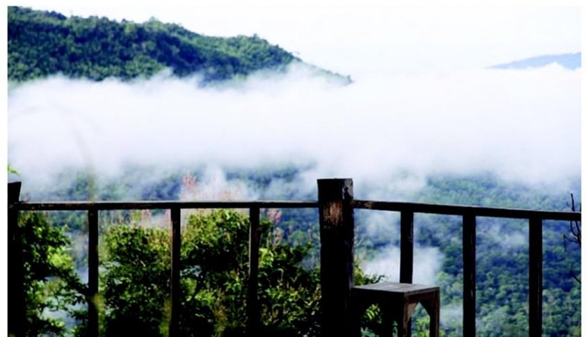
สดชื่นกลางสายหมอกที่วังน้ำเขียว