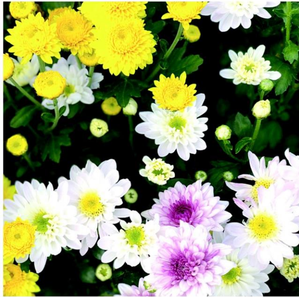
เบญจมาศหลากสี ทาชมได้ในงาน

โดยครอบคลุมกิจการท่องเที่ยว 10 ประเภท ได้แก่ 1.ภัตตาคาร ร้านอาหาร