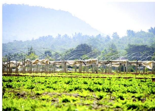
แปลงเกษตรในชุมชนวังน้ำเขียว