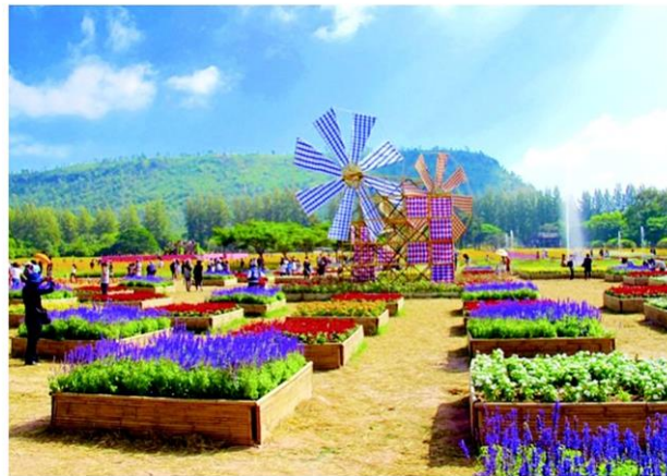
จิม ทอมป์สันฟาร์ม