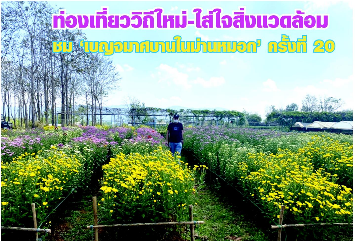
แปลงดอกเบญจมาศที่เกษตรกรปลูก