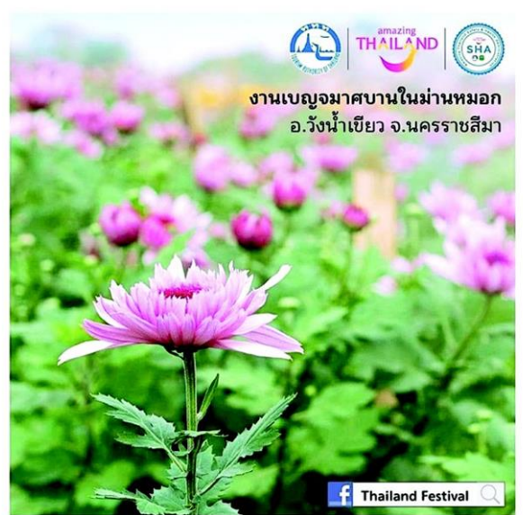
งานเบญจมาศบานในม่านหมอก ครั้งที่ 20

มาถึงในช่วงเดือนกุมภาพันธ์นี้ ท่ามกลางบรรยากาศที่เย็นสบายและโรแมนติค ที่ได้รับการขนานนามว่า "ไอโซนวังน้ำเขียว"