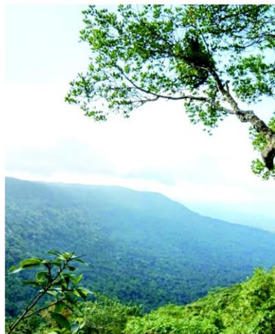
ธรรมชาติสวยงามที่เขาใหญ่