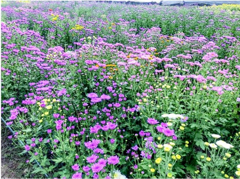
หลากหลายสีในงานเบญจมาศบาน