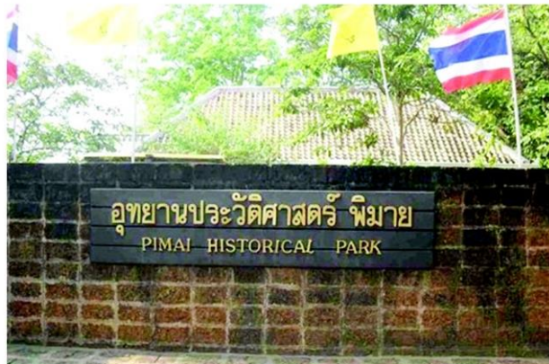
อุทยานประวัติศาสตร์ พิมาย

ผู้อำนวยการ ททท.สำนักงาน นครราชสีมา กล่าวต่อว่า ในส่วนของ ททท. นอกจากสนับสนุนการประชาสัมพันธ์การจัดงานดังกล่าวผ่านทุกช่องทางสื่อสาร โดยเฉพาะช่องทางโซเชียลมีเดียแล้ว ยังมอบ