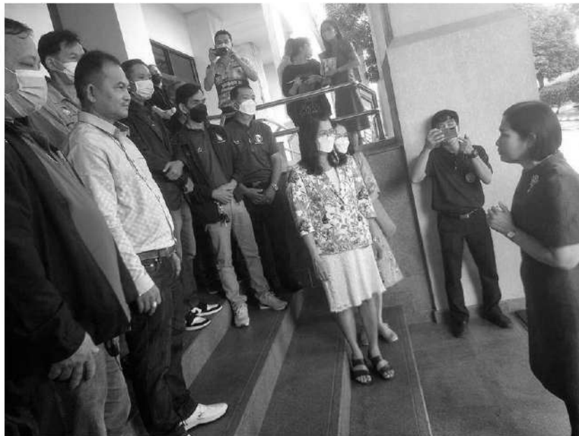
ค้านประกันยาง - กลุ่มเครือข่ายสถาบันเกษตรกรชาวสวนยางจังหวัดนครศรีธรรมราช ยื่นหนังสือถึงนายกรัฐมนตรี ผ่านรองผู้ว่าราชการจังหวัดนครศรีธรรมราช ขอให้ยกเลิกประกันรายได้ ราคายางพารา และทบทวนบอร์ดการยาง เมื่อวันที่ 8 ธันวาคม