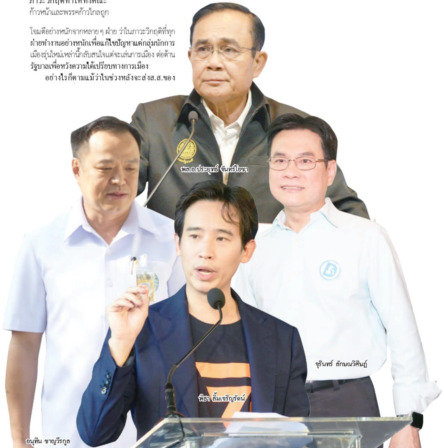
พล.อ.ประยุทธ์ จันทร์โอชา

พรรค สองคนที่เป็นหมอ ออกมาสื่อสารสาธารณะใน เชิงสร้างสรรค์มากขึ้น (เห็นบอกว่ายินดีใช้ความเป็น วิชาชีพหมอไปช่วยงานรัฐ เอาเลย...โรงพยาบาลในสาม จังหวัดชายแดนใต้กำลังต้องการหมอพอดี) รวมถึงการ ที่โฆษกพรรคก้าวไกลแสดงการสนับสนุนรัฐบาลในการ ออกมาตรการ “เราไม่ทิ้งกัน” เพื่อดูแลแรงงานนอก ระบบ รายละ 5,000 บาทต่อเดือน เป็นระยะเวลา 3 เดือน อย่างไรก็ตามไม่แน่ใจว่าการพลิกบทบาททางการเมือง เมืองตอนนี้จะทันหรือเปล่า ในเมื่อไฟไหม้ไปแล้วจาก