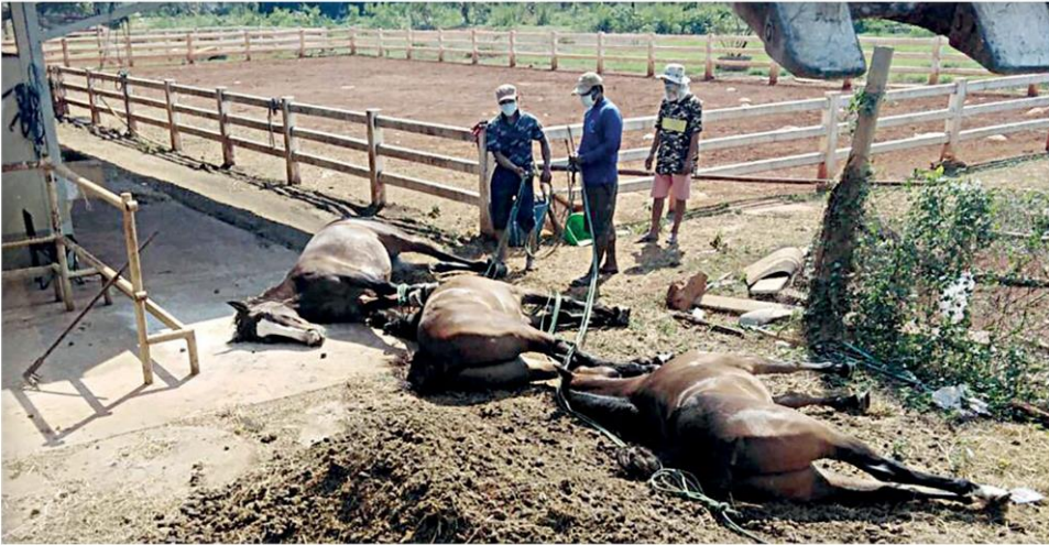
▲ภาพโรคม้า...ซากม้าแข่งที่ทยอยล้มตายจับปล้นภายในฟาร์ม เลี้ยงม้า อ.ปากช่อง จ.นครราชสีมา สร้างความแตกตื่นตกใจให้กับชาว บ้านที่ทราบข่าว โดยพบมีม้าตายแล้วใน 11 ฟาร์ม กรมปศุสัตว์เข้าไป ชันสูตร เบื้องต้นคาดสาเหตุเกิดจากติดเชื้อภาพโรคแอฟริกาในม้า