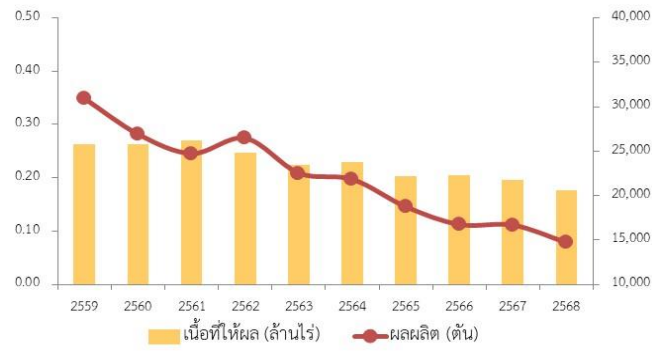
เนื้อที่ให้ผลและผลผลิต กาแฟ

แหล่งผลิต 5 อันดับแรก ได้แก่ 1.จ.เชียงราย 2.จ.เชียงใหม่ 3.จ.ชุมพร 4.จ.น่าน 5.จ.แม่ฮ่องสอน