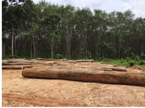
งานเปิดพื้นที่ห้วงงานเพื่อก่อสร้างโครงการฯ