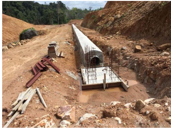
งานก่อสร้างระบบท่อส่งน้ำ