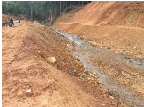
การปรับพื้นที่เพื่อก่อสร้างทำนบดิน