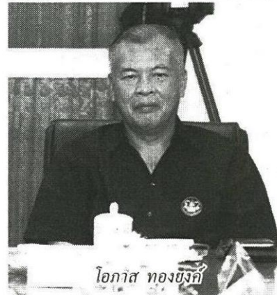
โอกาส ทองยงค์

โดยหนึ่งในเทคโนโลยีสำคัญที่ช่วยในการบริหารงานของสหกรณ์ และกลุ่มเกษตรกร คือ โปรแกรมระบบบัญชีสหกรณ์ครบวงจร (Cooperative Full Pack Accounting Software : FAS) ซึ่งกรมตรวจบัญชีสหกรณ์ ได้พัฒนาขึ้น เพื่อช่วยในการบริหารงานของสหกรณ์ และเป็นส่วนสำคัญในการช่วยบริหารจัดการงานภาคสหกรณ์ ให้มีประสิทธิภาพมากยิ่งขึ้น โปรแกรมดังกล่าว ได้รับการออกแบบให้ครอบคลุมตามธุรกิจของสหกรณ์ในทุกๆ ด้าน และมีความทันสมัย เป็นปัจจุบัน ช่วยลดข้อผิดพลาดในการทำงานและมีระบบข้อมูลทางบัญชีที่ได้มาตรฐานสามารถปิดบัญชีประจำปีได้อย่างรวดเร็ว จึงนับว่าเป็นเครื่องมือในการสร้างความแข็งแกร่งทางบัญชี และสามารถให้บริการสมาชิกแบบจุดเดียว (One Stop Service) เพื่อให้สหกรณ์และกลุ่มเกษตรกร มีเครื่องมือ