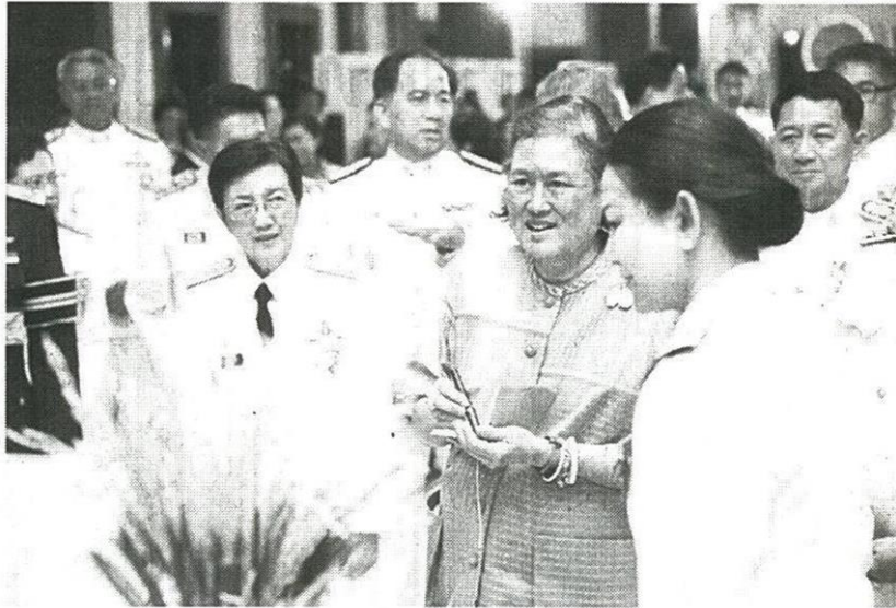
ทรงห่วงใยพันธุ์ข้าวพื้นเมืองสูญเสียเอกลักษณ์พัฒนาส่งเสริมชาวนาไทย...