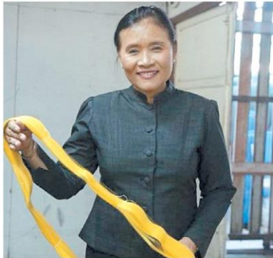
สุดารัตน์ วัชรคุปต์ เหล่าวิฆยา อธิบดีกรมหม่อนไหม

กรมหม่อนไหม จำนวน 16 แห่ง และช่วยลดต้นทุนการผลิตให้กับเกษตรกรสมาชิก บูรณาการสนับสนุนและขับเคลื่อนงานเกษตรทฤษฎีใหม่ เน้นเกษตรกรนอกพื้นที่แปลงใหญ่ไม่น้อยกว่า 1,500 ราย และส่งเสริมพัฒนาประสิทธิภาพการผลิตหม่อนไหมและฝ้ายภายใต้คณะ