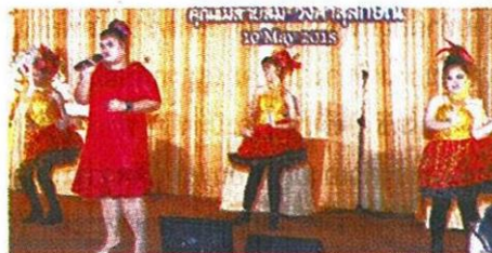
นักเรียนจากโรงเรียนเฉลิมพระเกียรติ 48 พรรษา ในพระราชูปถัมภ์ฯ จัดเต็มกับการแสดงบนเวทีให้กับผู้มีพระคุณ

แขกหรือที่มาร่วมงานได้มอบให้เจ้าของวันเกิดแทนของขวัญและดอกไม้ นั้น จะนำไปมอบให้สององค์กรสาธารณกุศล คือ โรงเรียนเฉลิมพระเกียรติ 48 พรรษา ในพระราชูปถัมภ์ฯ และมูลนิธิช่วยคนปัญญาอ่อนแห่งประเทศไทยในพระบรมราชูปถัมภ์ สมทบทุนค่าอาหาร 3 มื้อ แก่เด็กกำพร้า เด็กด้อยโอกาสของโรงเรียนเฉลิมพระเกียรติ 48 พรรษา ในพระราชูปถัมภ์ฯ และพัฒนาเด็กพิการทางสมองของมูลนิธิช่วยคนปัญญาอ่อนแห่งประเทศไทยในพระบรมราชูปถัมภ์ โดยไม่หักค่าใช้จ่ายใดๆ ทั้งสิ้น