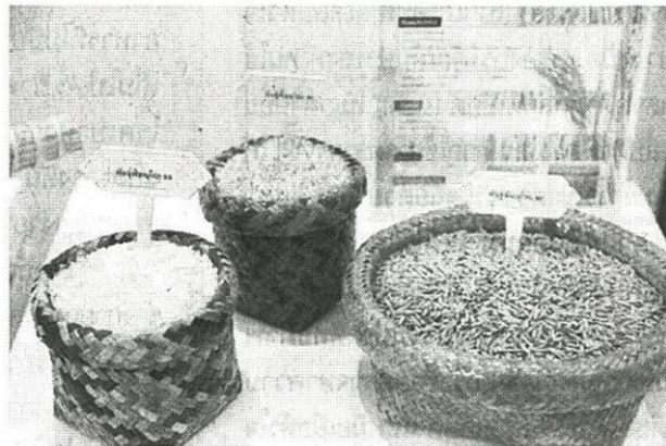
พันธุ์ข้าวพิษณุโลก 08 พันธุ์ข้าวพื้นเมืองที่ได้รับการอนุรักษ์พัฒนา

สมเด็จพระเทพรัตนราชสุดาฯ สยามบรมราชกุมารี เสด็จพระราชดำเนินไปเป็นองค์ประธาน ทรงเปิดงานการประชุมวิชาการข้าวแห่งชาติ ครั้งที่ 5 ประจำปี 2561 ซึ่ง สำนักงานพัฒนาการวิจัยการเกษตร (องค์การมหาชน) ร่วมกับหน่วยงานพันธมิตรมูลนิธิข้าวไทย ในพระบรมราชูปถัมภ์ สำนักงานพัฒนาวิทยาศาสตร์และเทคโนโลยีแห่งชาติ สำนักงานคณะกรรมการวิจัยแห่งชาติ กรมการข้าว มหาวิทยาลัยเกษตรศาสตร์ สำนักงานกองทุนสนับสนุนการวิจัย ธนาคารเพื่อการเกษตรและสหกรณ์การเกษตร และสำนักงานคณะกรรมการอาหารและยา จัดขึ้นภายใต้หัวข้องานวิจัยข้าวไทยสู่ไทยแลนด์ 4.0 เพื่อนำเสนอผลงานการพัฒนาข้าวไทยด้วยงานวิจัย นวัตกรรมที่ช่วยเพิ่มประสิทธิภาพการผลิตและการแปรรูปข้าวแบบครบวงจร ตั้งแต่