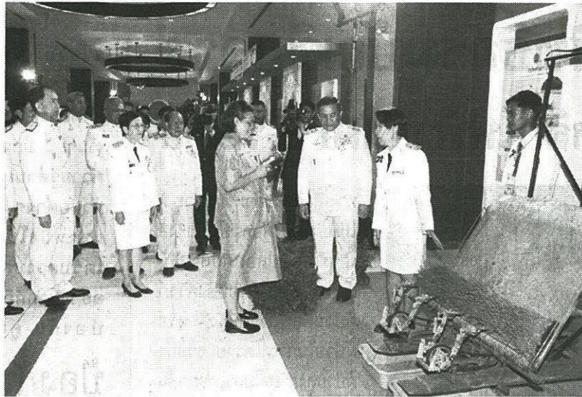
สมเด็จพระเทพรัตนราชสุดาฯ สยามบรมราชกุมารี ทอดพระเนตรรดน้ำนา ฝีมือนักเรียนวิทยาลัยเทคนิคชัยนาท