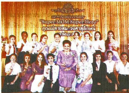
นักเรียนจากโรงเรียนเฉลิมพระเกียรติ 48 พรรษา ในพระราชูปถัมภ์ฯ มาแสดงความยินดีกับผู้มีพระคุณ