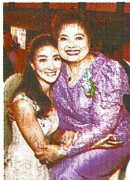
นางเอกคนดังก็มา แพนเค้ก-เขมณิจ จามิกรณ์