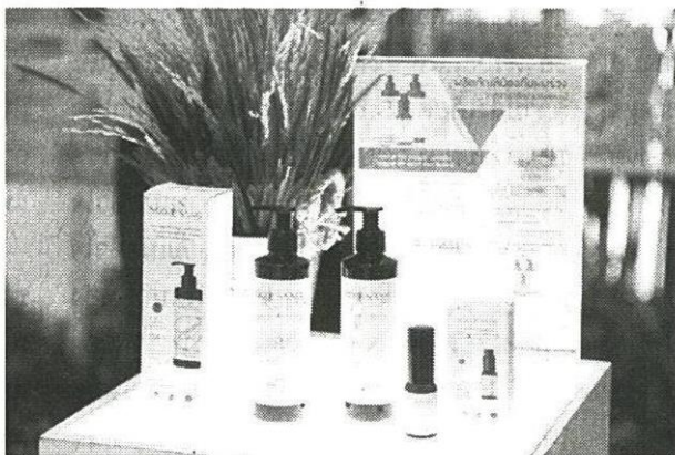
หนึ่งในผลิตภัณฑ์ที่ได้จากสารสกัดข้าวไทย

มูลนิธิข้าวไทย ในพระบรมราชูปถัมภ์ สำนักงานพัฒนาวิทยาศาสตร์และเทคโนโลยีแห่งชาติ สำนักงานคณะกรรมการวิจัยแห่งชาติ กรมการข้าว มหาวิทยาลัยเกษตรศาสตร์ สำนักงานกองทุนสนับสนุนการวิจัย ธนาคารเพื่อการเกษตรและสหกรณ์การเกษตร และสำนักงานคณะกรรมการการอาชีวศึกษา ร่วมเฟ้ารับเสด็จ