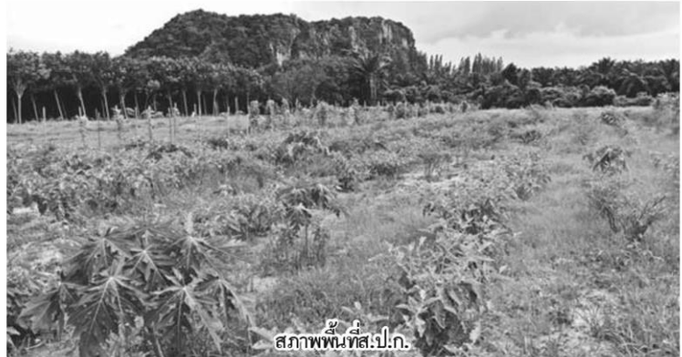
สภาพพื้นที่ส.ป.ก.

สำหรับแนวทางการพัฒนาในอนาคต กลุ่มมีความเห็นร่วมกันว่าจะยังคงพื้นที่ปลูกปาล์มน้ำมันไว้จนกว่าจะหมด