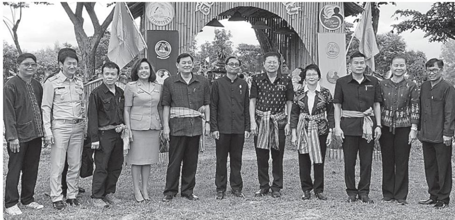
การผลิตข้าว นายสัตวแพทย์ฉันทย์เอนกวิทย์ รองปลัดกระทรวงเกษตรและสหกรณ์ เป็นประธาน เปิดงานวันถ่ายทอดเทคโนโลยีการผลิตข้าวภายใต้โครงการส่งเสริมการเกษตรแบบแปลงใหญ่ เนื่องในวันข้าว และชาวนาแห่งชาติ ระดับภาคตะวันออกเฉียงเหนือ ที่ศูนย์วิจัยข้าวหนองคาย อ.รัตนวาปี จ.หนองคาย.